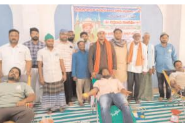
రక్తదానం చేస్తున్న యువకులు దృశ్యం