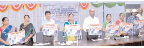
వాలిపోస్టర్లు విడుదల చేస్తున్న దృశ్యం

కర్నూలు, మేజర్ న్యూస్ ప్రతినిధి: బాలల హక్కులపై బాలులకు అవగాహన కల్పించేలా చర్యలు చేపట్టాలని రాష్ట్ర బాలల హక్కుల పరిరక్షణ కమిషన్ సభ్యులు డాక్టర్