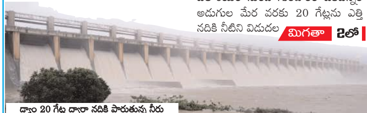
డ్యాం 20 గేట్ల ద్వారా నదికి పారుతున్న నీరు

హాళగుండ, మేజర్ న్యూస్: కర్ణాటక విజయ నగర (హోస్పేట్) జిల్లా వద్ద తుంగభద్ర జలాశయం నుండి గురువారం ఒకటిన్నర అడుగుల మేర వరకు 20 గేట్లను ఎత్తి నదికి నీటిని విడుదల