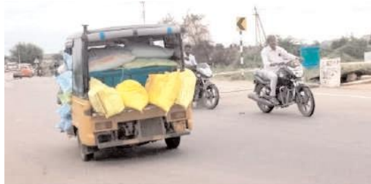
అటోలో అక్రమంగా తరలిస్తున్న ఎరువులు

మంత్రాలయంరూరల్, మేజర్ న్యూస్ : మంత్రాలయం మండల పరిధిలోని మాధవరం వద్ద ఉన్న చెక్ పోస్టును వ్యవసాయ అధికారులు తనిఖీలు చేపట్టకపోవడంతో అక్రమంగా కర్ణాటకకు ఎరువులు తరలుతున్నాయి. ఒక రాష్ట్రం ఎరువులు మరో రాష్ట్రానికి తరలించకూడదన్న నిబంధనలు ఉన్నప్పటికీ ఫర్టిలైజర్ వ్యాపారులు పట్టించుకోకుండా అక్రమంగా తరలిస్తున్నారు. రేయినక, పగలనకా కట్టపడి పనిచేసే రైతుకు కృత్రిమ ఎరువుల కొరతను సృష్టించి దొరికిన కాటికి దోచుకుంటున్నారని రైతులు ఆరోపిస్తున్నారు. నిబంధనల ప్రకారం చెక్ పోస్టు వద్ద వాహనాలను తనిఖీ చేయాలి, ఇలా కాకుండా అక్రమంగా తరలిస్తున్న ఎరువులను తనిఖీలు చేయకుండా ఎరువుల దుకాణ దారులతో కుమ్మక్కై తనిఖీలు చేపట్టడం లేదని రైతులు ఆరోపిస్తున్నారు. ఒక బస్సుపై రూ.50లు ధర పెంచి విక్రయించుకొని సొమ్ము చేసుకుంటున్నారన్న ఆరోపణలు వినిపిస్తున్నాయి. మాధవరం