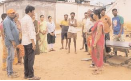
అవగాహన కల్పిస్తున్న ఉపాధి

చాగలమర్రి, మేజర్ న్యూస్ : మండలం లోని కదిరిపురం తండా గ్రామంలో ఉపాధి హామీ పథకం ద్వారా ఉద్యాన వన పంటల సాగుపై గురువారం అవగాహన కార్యక్రమాన్ని నిర్వహించారు. ఈ సందర్భంగా ఏపీవో నిర్వహణ మాట్లాడుతూ ఉపాధి హామీ పథకం కింద 350 ఎకరాల్లో ఉద్యాన పంటల సాగుకు గాను 146 ఎకరాలలో సాగుకు రైతులను గుర్తించామన్నారు. ఐదు ఎకరాల లోపు సన్న చిన్న కారు రైతులకు 16 రకాల పండ్ల తోటల సాగుకు అవకాశం ఉందన్నారు. ఉపాధి హామీ పథకం ద్వారా 100% సబ్సిడీతో రైతులు ఉద్యాన పంటలను సాగు చేసుకోవచ్చని వివరించారు. ఆసక్తిగల రైతులు తమ ఆధార్ కార్డు, పట్టాదారు పాస్ పుస్తకం, జాబ్ కార్డు తో ఎంపీడీవో కార్యాలయంలో సంప్రదించాలన్నారు. కార్యక్రమంలో ఉపాధి హామీ సిబ్బంది రైతులు పాల్గొన్నారు.