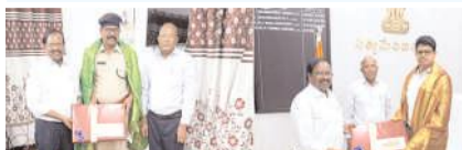
నంద్యాల జిల్లా ఎస్పీ, జాయింట్ కలెక్టర్ ను సన్మానిస్తున్న రామ్ కో సిమెంట్ అధికారులు

పూర్వకంగా కలిశారు. రామ్ కో సిమెంట్ ప్లాంట్ చుట్టు ప్రక్కల గ్రామాల్లో చేపడుతున్న అభివృద్ధి పనులను మరియే చేపట్టబోయే అంశాలపై కూడా వారు చర్చించారు. అలాగే సి.ఎస్.ఆర్ నిధులతో గ్రామాన్ని మరింతగా అభివృద్ధి పథంలో తీసుకెళ్తామని వారు తెలిపారు.