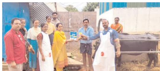
రైతుకు ఉచితంగా పశువుల మందులు అందజేస్తున్న వైద్యాధికారులు, సిబ్బంది.

బండిఅత్యుకారు రూరల్, మేజర్ న్యూస్ : మండలంలోని సోమయాజులపల్లె గ్రామంలో పశువులలో వచ్చే గర్భ కోశ వ్యాధులపై రైతులకు, ప్రజలకు అవగాహనా కార్యక్రమం