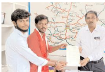
ఆదోని డిపో మేనేజర్ కు వినతిపత్రం ఇస్తున్న నాయకులు

★ విద్యార్థుల కాలినడకన కష్టాలను తీర్చండి