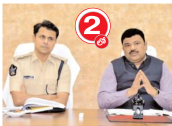
మాట్లాడుతున్న జిల్లా కలెక్టర్ పి. రంజిత్ బాబు