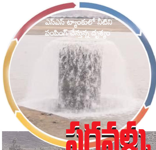
ఎస్ఎస్ ట్యాంకులో నీటిని పంపింగ్ చేస్తున్న దృశ్యం

ఆదోని, మేజర్ న్యూస్: పట్టణ ప్రజలకు తాగునీటి సమస్య తలెత్తక ముందే ఎల్లెల్లీ కెనాల్లో తుంగభద్ర నీరు పరవళ్ళు తొక్కాయి. తాగునీటి సమస్య పట్టణ ప్రజలకు ఇక ఉండదని అధికారులు ఊపిరి పీల్చుకున్నారు. మంగళవారం ఎల్లెల్లీ కాల్వకు తుంగభద్ర నీరు భారీ ఎత్తున వచ్చి చేరాయి. ఎస్ఎస్ ట్యాంకులో మరో 14రోజులకు నీటిని నిల్వ ఉంచేందుకు అధికార గళం