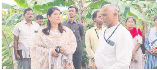
మహానంది మండలంలోని అరటి తోటలను పరిశీలిస్తున్న కలెక్టర్