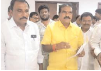
మిడుతూరు మేజర్ న్యూస్ :

ఆంధ్రప్రదేశ్ సచివాలయంలో గురువారం మిడుతూరు మండల టిడిపి కన్వీనర్ కాతా