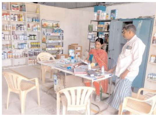
ఎరువుల దుకాణంలో రికార్డులను పరిశీలిస్తున్న మండల వ్యవసాయాధికారికి స్వాతి