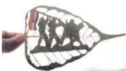
తలారి నిఖిత ఆకుపై కత్తిరించిన చిత్రం

ఆదోని, మేజర్ న్యూస్ : జూలై 26న కార్గిల్ విజయ దివాస్ సందర్భంగా ఆదోని మండలం అలసంద గుత్తి జిల్లా పరిషత్