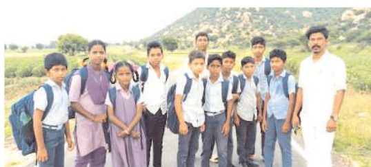
గ్రామం నుండి కాలినడకన ద్వారా హాళగుండకు వెళ్తున్న విద్యార్థులు