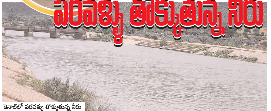
కెనాల్లో పరవళ్ళు తొక్కుతున్న నీరు

కొత్తపల్లి, మేజర్ న్యూస్: శ్రీశైలం జలాశయం లోకి ఎగువ ప్రాంతాల నుంచి గత రెండు రోజుల నుంచి అధిక నీరు వచ్చి చేరుతుండడంతో సప్తనదుల సంగమంలో ఉన్న సంగమేశ్వరుడు కృష్ణమ్మ ఒడిలోకి పూర్తిగా ఒదిగి పోనున్నాడు. గురువారం సంగమేశ్వర ఆలయ శిఖరం వరకు పూర్తిగా మునిగి శిఖర దర్శనం కనువిందు చేసింది. ప్రస్తుతం జలాశయంలో 856 అడుగుల నీటి మట్టం చేరుకుంది. మరో నాలుగు అడుగుల నీరు చేరినట్లయితే ఆలయం పూర్తిగా నీటిలో మునిగి కొన్ని నెలలపాటు కృష్ణా నదిలోనే మునిగి జలాదివాసమై