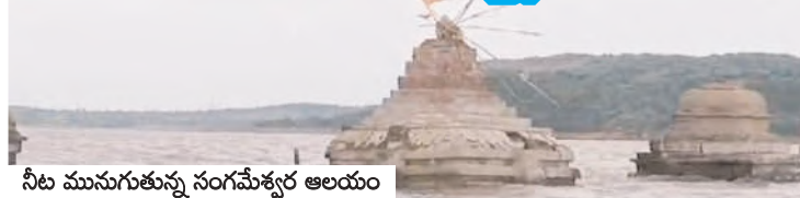
నీటి మునుగుతున్న సంగమేశ్వర ఆలయం