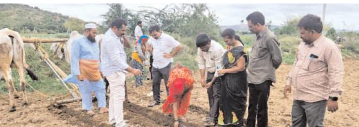
పత్తిపంట విత్తు గురించి రైతుకు అవగాహన కల్పిస్తున్న వ్యవసాయశాఖ అధికారులు