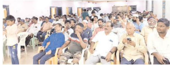
హాజరైన బలిజ కాపు సేవా సమితి సభ్యులు