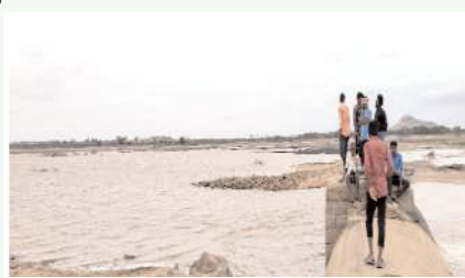
ఆర్దియస్కు చేరుకున్న నీరు

కోసిగి, మేజర్ న్యూస్: ఆంధ్ర, కర్ణాటక రాష్ట్రాలలో కురిసిన భారీ వర్షాలకు తుంగభద్ర డ్యాంంలో భారీవత్తున నీరు చేరుకోవడం జరుగుతుంది. దీనితో తుంగభద్ర డ్యాంనుండి తుంగభద్ర నదికి నీటిని విడుదలచేసి మూడురోజులు కావస్తుంది. అయితే గురువారం మధ్యాహ్నం అగసనూరు సమీపంలో ఉన్న ఆర్దియస్ ఆనకట్టకు తుంగభద్ర డ్యాంనీరు చేరుకోవడంతో ఆనకట్టవద్ద జలకళతో కళకళలాడుతుంది. తుంగభద్ర డ్యాంనుండి మళ్ళీ 33గేట్లు ద్వారా నీటిని విడుదల చేసేఅవకాశాలు ఉండడంతో పొంగిపొర్లుతున్న సమయంలో రిజర్వాయర్లకు ఎత్తిపోతల పథకాల ద్వారా నీటిని పంపిణీచేయాలని రైతులు కోరుతున్నారు. అలాగే నదిలో నీరు ప్రవహించడంతో రైతు కళ్ళలో ఆనందం, ఆర్ధం వ్యక్తంచేయడం జరిగింది.