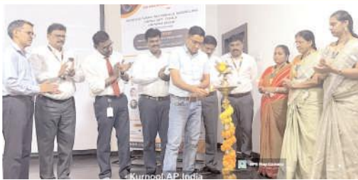
జ్యోతి ప్రజ్వలన చేస్తున్న దృశ్యం

కల్లూరు, మేజర్ న్యూస్: కల్లూరు మండల పరిధిలోని అశోకా కళాశాలలో ఇన్-సిలికోనాస్ మెటీరియల్ మోడలింగ్ పై ఇంటర్నేషనల్ వర్క్ షాప్ ప్రారంభమైంది. ఈ వర్క్ షాప్ 29వ తేదీ వరకు