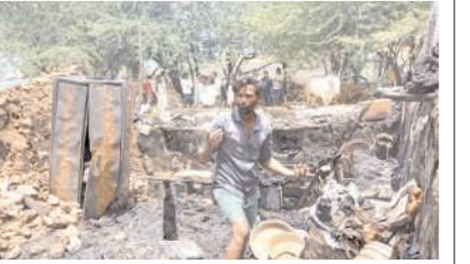
అగ్ని అహతికి నర్సం కోల్పోయినట్లు చెబుతున్న బాధితుడు