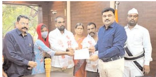
కలెక్టర్ కు వివరాలను అందించే సమయం