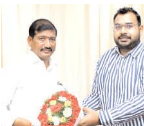
ఎంపీ నాగరాజుకు పూజాతోడి అందజేస్తున్న కమిషనర్

కర్నూలు నగరం, మేజర్ న్యూస్: కర్నూలు ఎంపీ బస్తిపాటి నాగరాజు, నగర పాలక సంస్థ కమిషనర్ భార్యవరదాక గురువారం నగర పాలక కార్యాలయంలో తొలిసారి మర్యాదపూర్వకంగా భేటీ అయ్యారు. ఈ సందర్భంగా ఎంపీకి కమిషనర్ పుష్పగుచ్ఛం అందజేసి శుభాకాంక్షలు తెలిపారు. నగరాభివృద్ధికి పూర్తి సహాయం, సహకారాలు అందిస్తామని తెలిపారు. నగరానికి సంబంధించి సమస్యల పరిష్కారానికి కృషి చేస్తామని ఎంపీ పేర్కొన్నారు. అనంతరం నగరంలో చేపట్టిన అభివృద్ధి, సమస్యలపై ఎంపీ, కమిషనర్ చర్చించారు.