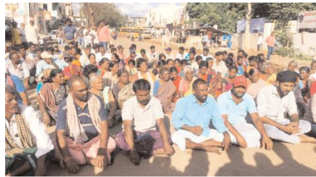
పోలీస్ స్టేషన్ ఎదుట బాలిక బంధువులు ధర్నా చేస్తున్న దృశ్యం

నందికొట్కూరు మేజర్ న్యూస్ : నందికొట్కూరు పోలీస్ స్టేషన్ ఎదుట కేజీ రోడ్డుపై బెర్రాయింది బాలిక బంధువులు ధర్నా చేశారు. బాధిత కుటుంబానికి న్యాయం జరిగేంత వరకు ధర్నా విరమించేది లేదని బిస్మిళుకొని కూర్చున్నారు. సంఘటన జరిగి ఐదురోజులైనా ఇంతవరకు బాలిక ఆమాకీ తెలియకపోవడం ఏమిటని ప్రశ్నించారు. మైనర్లను విచారించేందుకు వీలుకాకపోతే వారి పెద్దలను పిలిపించి విచారణ చేపట్టాలని డిమాండ్ చేశారు. రాష్ట్ర, జాతీయ విపత్తు నిర్వహణ బృందాలు గాలింపు చేపట్టిన మృత దేహం లభ్యం కాలేదంటే దీనిని మేము మిగతా రిపోర్ట్