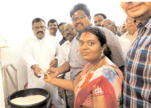
తక్కువ ధరకు సన్న బియ్యాన్ని మహిళకు అందిస్తున్న ఎమ్మెల్యే కోట్ల