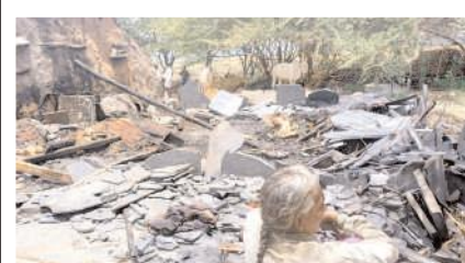
పూర్తిగా కాల్పోయిన గుడిసెలో దీనంగా కూర్చున్న మహిళ