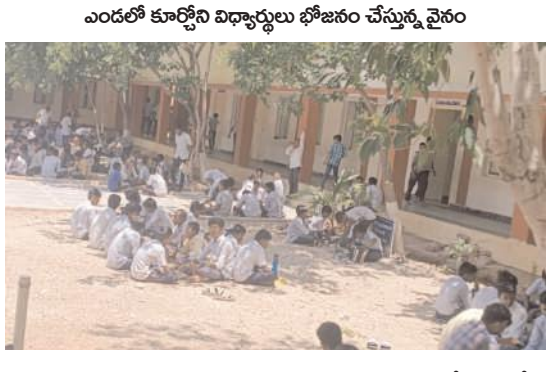
పెద్దకడుబూరు మేజర్ న్యూస్ : పెద్దకడుబూరు మండల కేంద్రంలోని

స్థానిక ఆదర్శ పాఠశాలలో సుమారుగా 400వందలకు పైగా విద్యార్థులు తమ విద్యాభ్యాసం కొనసాగిస్తున్నారు. అయితే మధ్యాహ్నం భోజనం సమయంలో కొంత మంది విద్యార్థిని విద్యార్థులు భోజనం చేయాడానికి పాఠశాలలో ప్రత్యేక గదులు లేక పోవడంతో పలువురు విద్యార్థులు పాఠశాల ఆవరణలో ఇళ్ళనుండి తెచ్చుకున్న క్యారర్లను విచ్చుకొని నేలపైనే ఎండలో కూర్చోని భోజనం చేయాల్సిన పరిస్థితి ఉందని పలువురు విద్యార్థులు వాపోతున్నారు. అదే విధంగా పాఠశాలకు ప్రహారీ గోడలు లేకపోవడంతో ముళ్ళు కంపతో నిండిపోయిందని తెలిపారు. విద్యార్థులు ఆటలు ఆడుకోవలన్న చాల ఇబ్బందికరంగా మారందని వారన్నారు. ఇప్పటికైనా అధికారులు స్పందించి పాఠశాల చుట్టూ ప్రహారీగోడ నిర్మించాలని విద్యార్థులు కోరుతున్నారు.