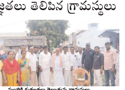
మంత్రికి కృతజ్ఞతలు తెలుపుతున్న గ్రామస్థులు