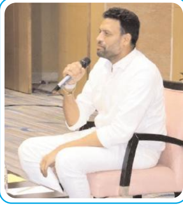
సమావేశంలో మాట్లాడుతున్న మంత్రి టీ.జి. భరత్