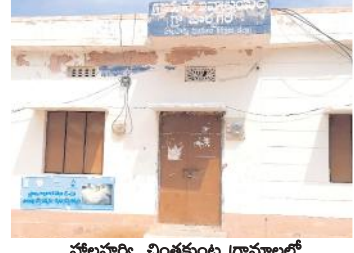
హోలహర్వి, చింతకుంట గ్రామంలో మాతపడిన సచివాలయాల

హోలహర్వి, మేజర్ న్యూస్: హోలహర్వి మండలంలోని హోలహర్వి, చింతకుంట. 2 సచివాలయాలలో ఉద్యోగులు దుమ్మా కొట్టడంతో