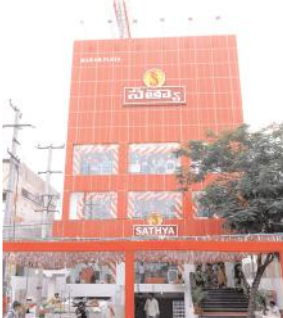
ప్రారంభమైన రెండవ బ్రాంచ్