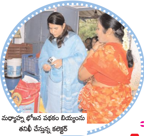
మధ్యాహ్న భోజన పథకం బియ్యంను తనిఖీ చేస్తున్న కలెక్టర్

నంద్యాల కలెక్టర్, మేజర్ న్యూస్ : నంద్యాల జిల్లా కలెక్టర్ రాజకుమారి పదవీ బాధ్యతలు చేపట్టిన వెంటనే అధికారులను, ఇతర శాఖలను ఆకస్మికంగా తనిఖీ చేస్తూ అధికారులను పరుగులు పెట్టిస్తూ... మరోపక్క ఆకస్మికంగా పాఠశాలలు, ప్రభుత్వ కార్యాలయాల తనిఖీ చేస్తూ హడల్ పుట్టిస్తున్నారు. శుక్రవారం నంద్యాలలో బస్టాండ్ ప్రాంతంలో ఉన్న ఎంతో పేరు