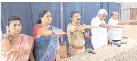
విద్యార్థులతో ప్రతిజ్ఞ చేయిస్తున్న దృశ్యం