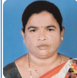
హత్యకు గురైన గుండమ్మ (ఫ్రెండ్ ఫోటో)