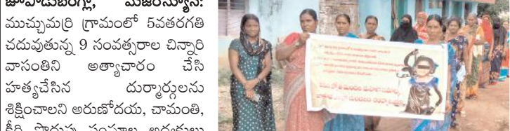
ర్యాలీ నిర్వహిస్తున్న పొదుపు సంఘాలు