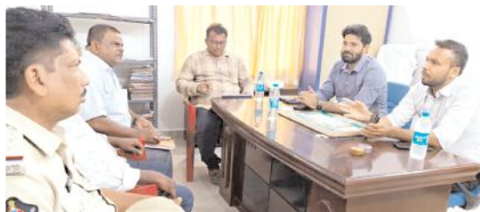
మహానందిలో అధికారులతో సమావేశం నిర్వహిస్తున్న జేసీ