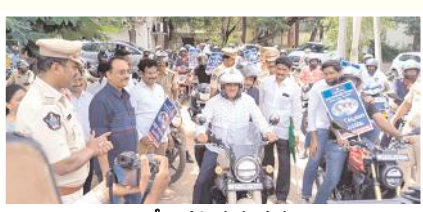
రాలీ నిర్వహిస్తున్న దృశ్యం

కర్నూలు లీగల్, మేజర్ న్యూస్: ద్విచక్ర వాహన దారులు హెల్మెట్ లేని ప్రయాణం చేయడం ప్రమాదకరమని కర్నూలు జిల్లా జడ్జి శ్రీనివాసరావు అన్నారు. శుక్రవారం నగరంలోని జిల్లా కోర్టు ఆవరణలోని న్యాయ సేవ సదస్ నుంచి రాజ్ విహార్ వరకు బైక్ రాల్ఫీ నిర్వహించారు. ఆంధ్రప్రదేశ్ చీఫ్ జస్టిస్ ఆదేశాల ప్రకారం వాహనదారులకు అవగాహన కల్పిస్తున్నట్లు తెలిపారు. ఈ సందర్భంగా జిల్లా జడ్జి శ్రీనివాసరావు మాట్లాడుతూ హెల్మెట్ లేకుండా ప్రయాణం చేసి జీవితాలను నాశనం చేసుకోవద్దారు. ద్విచక్ర వాహనదారులు తప్పక హెల్మెట్ ధరించాలన్నారు. ఫోర్ వీల్ వాహనదారులు తప్పక సీట్ బెల్టు ధరించాలన్నారు. ప్రాణం ఎంతో విలువైనదని, చిన్నపాటి నిర్లక్ష్యంతో వాటిని పోగొట్టుకోవద్దన్నారు. ఈ కార్యక్రమంలో న్యాయవాదులు, సంబంధిత పోలీసు శాఖ అధికారులు, ట్రాఫిక్ సిబ్బంది పాల్గొన్నారు.