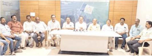
నమావేళంలో మాట్లాడుతున్న వైయస్సార్‌సీపీ లీగల్ సెల్ ప్రతినిధులు

నంద్యాల రూరల్, మేజర్‌న్యూస్ : టీడీపీ ప్రభుత్వం సంక్షేమం, అభివృద్ధిపై దృష్టి సారించాలని ఇకనుంచైనా వైసీపీ కార్యకర్తలపై , నాయకులపై దాడులు సంస్కృతికి చరమగీతం పాడాలని నంద్యాల