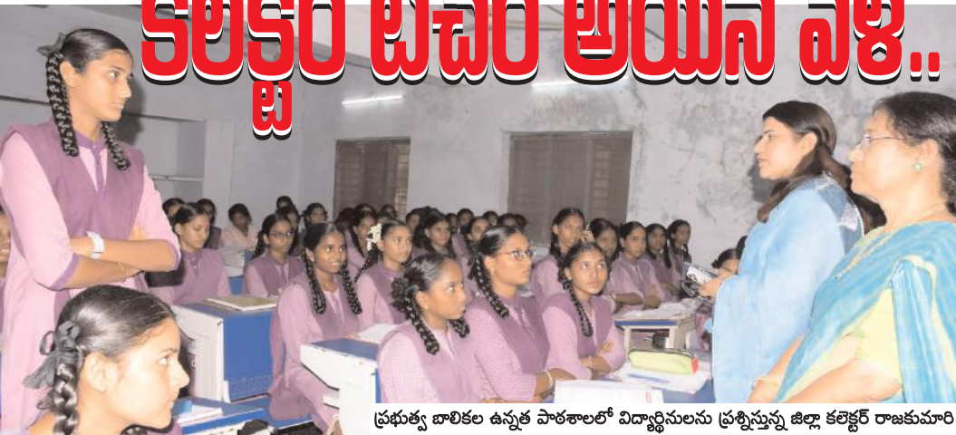
ప్రభుత్వ బాలికల ఉన్నత పాఠశాలలో విద్యార్థినులను ప్రశ్నిస్తున్న జిల్లా కలెక్టర్ రాజకుమారి