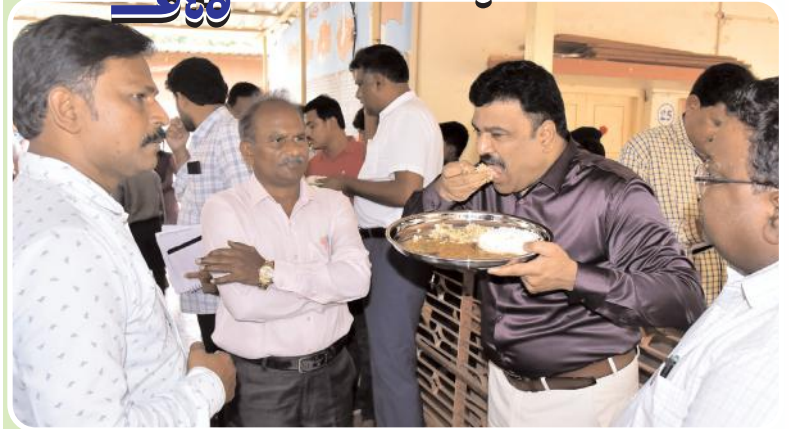
భోజనాన్ని రుచి చూస్తున్న కలెక్టర్ పి.రంజిత్ బాబు