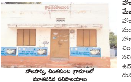
హోలహర్వి చింతకుంట గ్రామంలో మాతపడిన సచివాలయాల

ఆఫీసులకు తాళాలు వడ్డాలు. చింతకుంట. 2 సచివాలయంలో స్టాఫ్ తక్కువగా ఉన్నారని విధులకు వచ్చిన సర్వేయర్ ఫీల్డ్ మీద వెళ్లినట్లు తెలిపారు. ఇక మండల కేంద్రమైన హోలహర్వి లో సెక్రటరీ విధులకు వచ్చినా తాళాలు లేకపోవడంతో చెట్లు కిందే విధులు నిర్వహించారు. అసలు గతంలో మాదిరిగా సచివాలయ ఉద్యోగులు తాము విధులకు వచ్చినట్లు తంటే ద్వారా ఆఫీసులో ప్రజెంట్ వేసుకునే వారు. అయితే వైసీపీ ప్రభుత్వం ఫేస్ ఐడి పెట్టడంతో చాలామంది ఉద్యోగులు కార్యాలయాల సమీపంలో ఫేస్ ఐడి వేసి తమ పనులు చక్కబెట్టుకునే వారు. నూతన ప్రభుత్వంలో సచివాలయ ఉద్యోగులు