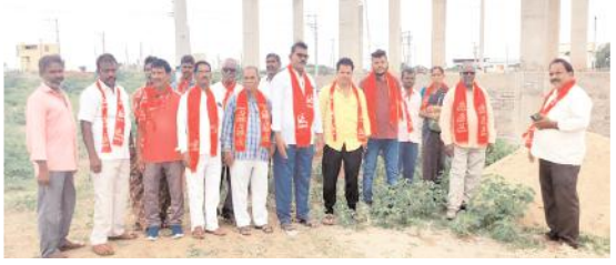
కాలనీని పరిశీలిస్తున్న సీపీఎం బృందం

కల్లూరు, మేజర్ న్యూస్: పందిపాడు గవర్నమెంట్ కాలనీలో పేదలు ఇళ్లు నిర్మించుకు నేందుకు రూ.5లక్షలు ఇవ్వాలని సీపీఎం నాయకులు