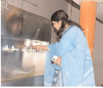
సీడి కోఠాలను పరిశీలిస్తున్న కలెక్టర్