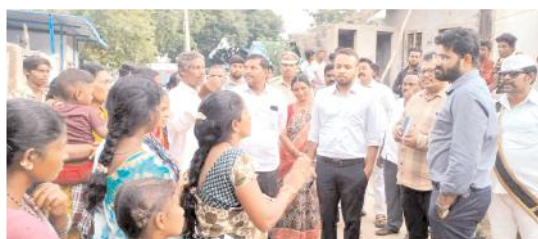
గిరిజన గూడెంలో సందర్శిస్తున్న దృశ్యాలు