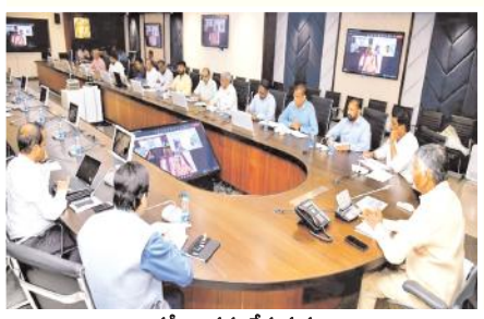
సమీక్షా సమావేశ దృశ్యం

బనగానపల్లె, మేజర్ న్యూస్ : అమరావతి సచివాలయంలో ఆర్.ఆం.బి శాఖపై ముఖ్యమంత్రి చంద్రబాబునాయుడు సమీక్షా సమావేశం నిర్వహించారు. ఈ సమీక్షలో రోడ్ల దుస్థితి నిధుల అవసరం ప్రస్తుతం ఉన్న సమస్యలపై సి.ఎం.కు అధికారులు వివరించారు. రాష్ట్రంలో 4150 కిలోమీటర్లు రోడ్లు గుంతలు ఉన్నాయని తక్షణమే మరమ్మత్తులు చేయాల్సి రోడ్లు మరో 2936 కిలోమీటర్లు ఉన్నాయని తెలిపారు. మొత్తంగా రాష్ట్రంలో 7087 కిలోమీటర్ల పరిధిలో తక్షణ పనులు చేయాలని వీటి కోసం 300కోట్ల నిధులు అవసరం అవుతాయని తెలిపారు. వాటన్నింటిని వెంటనే పనులు పూర్తి చేయాలని సి.ఎం ఆదేశించారు. నిర్మాణంలో రోడ్ల మరమ్మత్తుల్లో కొత్త సాంకేతికతను వినియోగించే విషయంపై తిరుపతి బి.ఐ.టి, ఎస్.ఆర్.ఎం యూనివర్సిటీలకు చెందిన ప్రొఫెసర్లు , ప్రభుత్వ అధికారులు నిర్మాణరంగ నిపుణులతో చర్చించారు.