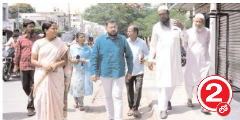
రహదారిని పరిశీలిస్తున్న దృశ్యం