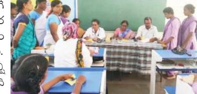
విద్యార్థినిలకు వైద్య పరీక్షలు చేస్తున్న వైద్యులు