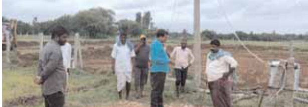
రోడ్డును తొలగించకుండా వదిస్తున్న వ్యక్తి