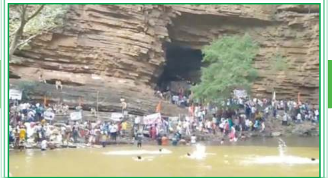
ఫారెస్ట్ అధికారులు పులుల సంరక్షణ పేరిట భక్తులకు ఆంక్షలు విధిస్తూ అనుమతి నిరాకరిస్తున్నారు. భక్తుల మనోభావాలకు అనుగుణంగా దైవ దర్శనానికి అనుమతనిస్తూ ఈ ప్రాంతాన్ని పర్యాటక కేంద్రంగా మార్చాలని ప్రజలు కోరుతున్నారు.