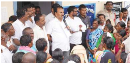
గ్రామస్థులతో మాట్లాడుతున్న మంత్రి జూపల్లి కృష్ణారావు