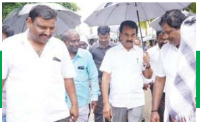
సంగినేపల్లి గ్రామంలో వర్షంలో పర్యటిస్తున్న మంత్రి