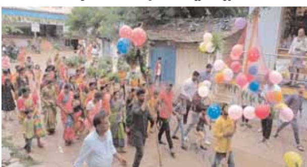
బోనాలతో ఊరేగింపుగా వెళ్తున్న మహిళలు.