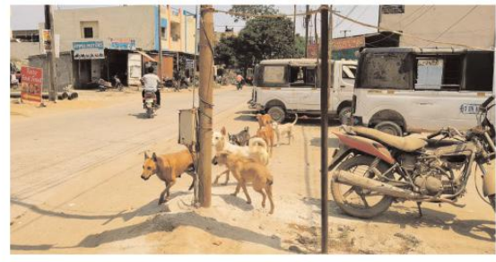
నెలకొన్నాయంటున్నారు. వీధి కుక్కల నియంత్రణ బాధ్యత అధికారులపై ఉందని తక్షణమే మున్సిపాలిటీలోని వీధి కుక్కలను వేరే చోటికి తరలించేలా చర్యలు తీసుకోవాలని మున్సిపల్ వాసులు కోరుతున్నారు.

జిన్నారం మేజర్ న్యూస్:బొల్లారం మున్సిపాలిటీ పరిధిలో వీధి కుక్కల బెడద రోజురోజుకు పెరుగుతోందని స్థానికులు ఆందోళన వ్యక్తం చేస్తున్నారు.పెరుగుతున్న కుక్కలతో రోడ్లపైకి రావాలంటే జనాలు జంకుతున్నారు.గత కొన్ని రోజుల కింద గాంధీనగర్, బీరప్ప బస్టి, బాలాజీ నగర్, చర్చి బస్టి,పోచమ్మ బస్టిలో వీధి కుక్కలు పలువురు పెద్దలు చిన్నలపై దాడి చేసి తీవ్రంగా గాయపరిచిన సందర్భాలు కూడా ఉన్నాయి. వీధి కుక్కలను కట్టిడి చేయడంలో మున్సిపల్ అధికారులు ఫిర్యాదులు చేసిన చర్యలు తీసుకోవడంలో అలసత్వం ప్రదర్శిస్తున్నారని స్థానికులు వాపోతున్నారు. ప్రతి గల్లీలో నిరంతరం వీధి కుక్కలు సంచరిస్తున్నాయని పాదచారులు వాహనదారులు రోడ్లపై వెళుతుంటే అమాంతం మీద పడి దాడి చేస్తున్నాయని, రాత్రి వేళల్లో సైతం ప్రాణాలు అరచేతిలో పెట్టుకొని సంచరించాల్సి పరిస్థితులు