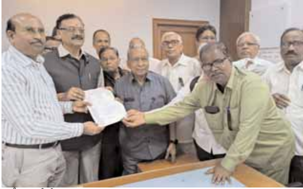
సిటీబ్యూరో,మేజర్న్యూస్: తెలంగాణ రాష్ట్ర వ్యాప్తంగా ఉన్న 2.8లక్షల మంది పెన్షనర్ల బాగాగులు,సమస్యలను పరిష్కరించేందుకు తగిన రాష్ట్ర ప్రభుత్వం తగిన