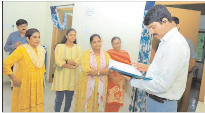
నల్గొండ జిల్లా ట్యూర్

ఎలాంటి ఆధారం లేని మహిళలకు సఖి, స్వధార్ కేంద్రాలు అండగా నిలబడాలి