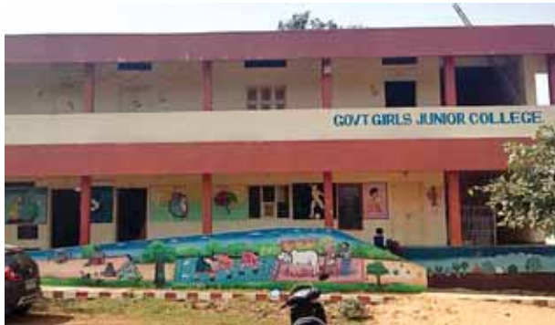
ఆత్మకూరులో బాలికల ప్రభుత్వ జూనియర్ కాలేజి ప్రవేశ మార్గం