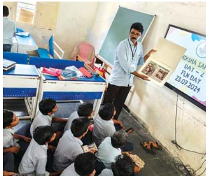
సంబంధించి విద్యార్థుల చేత ఎఫ్ఎల్ఎన్ ప్రతిజ్ఞ

భారత ప్రభుత్వ మానవ వనరుల అభివృద్ధి శాఖ, ఆంధ్రప్రదేశ్ రాష్ట్ర పాఠశాల విద్యాశాఖ ప్రతిష్టాత్మకంగా చేపట్టిన శిక్ష సప్తహాలో భాగంగా రెండవ రోజు పునాది అభ్యసన, సంఖ్యాశాస్త్ర నైపుణ్యాల అభివృద్ధి కార్యక్రమం స్థానిక బాలురు ఉన్నత పాఠశాలలో ఘనంగా నిర్వహించారు. ఈ కార్యక్రమంలో భాగంగా విద్యార్థులను ఆటలు, కృత్యాల లో నిమగ్నం చేయడం.. కథల చెప్పడంలో మెలకువలు, బొమ్మలు ఆటల ద్వారా అభ్యసనం కార్యక్రమాలపై అవగాహన కలిగించారు. దీనికి