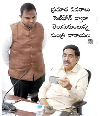
ప్రమాద వివరాలు సెల్ ఫోన్ ద్వారా తెలుసుకుంటున్న మంత్రి నారాయణ

చేరుకొని విద్యార్థి మృతదేహాన్ని పరిశీలించారు. ఘటనపై విద్యార్థులు, ఉపాధ్యాయుల నుంచి వివరాలను సేకరించారు. శవ పరీక్ష నిమిత్తం మృతదేహాన్ని జీజీహెచ్ కు తరలించి కేసు నమోదు చేసి దర్యాప్తు చేస్తున్నట్లు సీబి తెలిపారు.