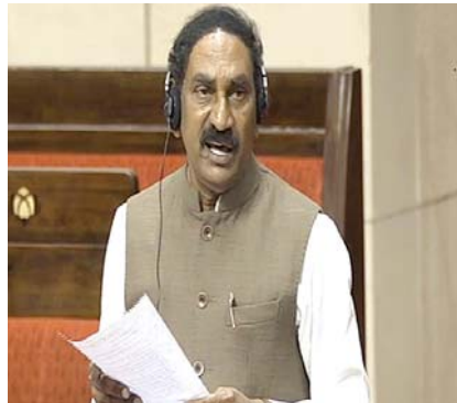
నెల్లూరు (వైద్యం), మేజర్స్ న్యూస్ : ఏపీ, నెల్లూరు జిల్లాలో పెండింగ్లో ఉన్న రోడ్ ఓవర్ బ్రిడ్జిస్