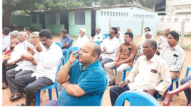
పాల్గొన్న సమితి ప్రతినిధులు