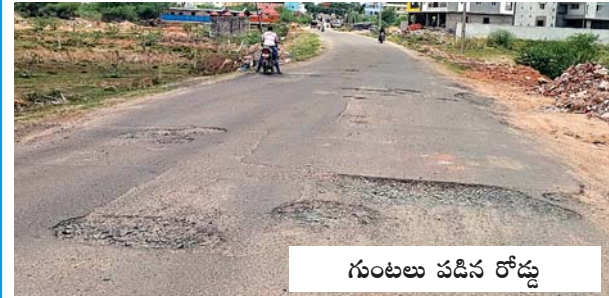
గుంటలు పడిన రోడ్డు

ఆత్మకూరు, మేజర్స్ న్యూస్ : ఆత్మకూరు పట్టణంలో నుండి నెల్లూరు-ముం బాయి జాతీయ రహదారి వరకు ఉన్న బైపాస్ రోడ్డు అడుగడుగునా గుంటల మయమై వాహనకారులకు, పాదచారులకు అవస్థలుగా ఉండగా అనాదిగా గత ప్రభుత్వం నిర్లక్ష్యం చేసిందని, గుంటలు మరింతగా ఇబ్బంది పెడుతున్నాయని అందరూ వాపోతుండగా రెండేళ్ళక్రితం పనులు ఆడంబరంగా ప్రారంభించి అర్ధాంతరానికి పరిమితం చేశారు. ఏదో తూతూమంత్రంగా కొంత మేరకే తారురోడ్డు నిర్మించి మిగతా ప్యావ్లతో సరిపెట్టారు. మళ్ళీ స్వల్పకాలంలోనే గుంటలు పడుతూ అవస్థలు ఆరంభమవుతున్నాయని అందరూ విమర్శిస్తున్నారు. ఈమార్గంలో బస్సులు నడవకున్నా ఇతర వాహనాలన్నీ ఇదేమార్గంలో రాకపోకలు సాగిస్తుంటాయి. అడిగాక వాకింగ్ కోసం నిత్యం అధికంగా జనాలు ఈమార్గంలో నడుస్తుంటారు. రోడ్డుకు అడగుడునా పెద్ద గుంటలు పడి రోడ్డు దెబ్బతిని ఉండడంతో అటు వాహనకారులకు, ఇటు పాదచారులకు అసౌకర్యంగా, ఇబ్బందిగా ఉందని పలువురు వాపోతుండేవారు. గతంలో ఈరోడ్డు దుస్థితి పరిశీలించి చర్యలు