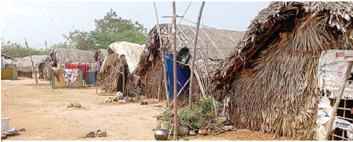
తాటాకుపూరి గుడిసెల్లో నివాసాలుంటున్న గిరిజనులు