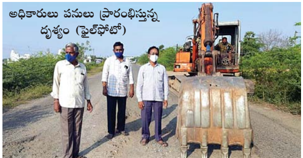
అధికారులు పనులు ప్రారంభిస్తున్న దృశ్యం (ఫైల్ ఫోటో)

తీసుకోవాలంటూ సిపిఎం పాదయాత్ర చేయగా జనసేన రోడ్డుపై బైరాయింబి ధర్నా కూడా చేశారు. ప్రాధాన్యత కలిగిన ఈరహదారికి కనీస మరమ్మత్తులు చేపట్టాలన్న ఆలోచన అటు అధికారుల్లో కానీ, ఇటు పాలకుల్లో కానీ కలుగకపోవడం లేదని, తరచూ ఇదే మార్గంలో ప్రయాణించే అధికారులు, ప్రజాప్రతినిధులు, నాయకులు నిర్లక్ష్యం చేస్తున్నారని పలువురు ప్రయాణికులు, వాహనకారులు వ్యాఖ్యానిస్తుండేవారు. కాగా అప్పటి మంత్రి మేకపాటి గౌతంరెడ్డి ప్రత్యేకశ్రద్ధతో 76.5లక్షల రూపాయలు మంజూరు చేయించారని అధికారులు తెలిపారు. 2021 మార్చి 3వతేదీన