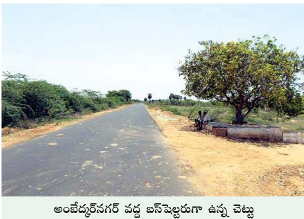
అంబేద్కర్ నగర్ వద్ద బస్ షెల్టరుగా ఉన్న చెట్టు