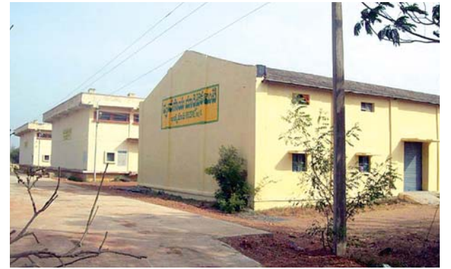
ఆత్మకూరు వ్యవసాయమార్కెట్ కమిటీ గోదాన్లు

గతంలో ఈ నియోజకవర్గ తెలుగుదేశం ఇన్ చార్జ్ గా ఉన్న గూటూరు మురళీకన్నబాబు కూడా ఆత్మకూరు మార్కెట్ కమిటీకి గోదాన్లు మంజూరు చేయాలని ప్రభుత్వాన్ని కోరారు. 2000 మెట్రిక్ టన్నుల నిల్వసామర్థ్యం కలిగిన గోదాన్ మంజూరుకు ప్రతిపాదించారు. కానీ గోదాన్ల నిర్మాణాలకు నిధులు మంజూరుకాలేదు. సీజనల్ రైతులు పండించిన ధాన్యానికి గిట్టుబాటు ధరలు లేకుంటే రైతులు ధాన్యంను మార్కెట్ కమిటీ గోదాన్ లో నిల్వచేసుకోవడం, రైతుబంధుపథకం ద్వారా 75 శాతం నిధులు రుణాలుగా వడ్డీలేనివరహాలో పొందడం జరుగుతుంటుంది. నిల్వ చేసే ధాన్యానికి భీమా సౌకర్యం కూడా ఉంటుంది. కానీ ఆత్మకూరు వ్యవసాయమార్కెట్ కమిటీకి గోదాముల కొరత వలన 2010 సంవత్సరంలో 110 మంది రైతులు 1.10 కోట్ల రూపాయల విలువగల ధాన్యం మాత్రమే నిల్వ చేశారు. 2011లో 34 మంది రైతులు రైతులు ధాన్యం నిలువచేయగా ఫీజింగ్ అంటూ రెండు నెలలనంతరం 29 మందికి 16.44 లక్షల మాత్రమే చెల్లించారు. 2012లో 5 మంది రైతులు మాత్రమే ధాన్యం నిలువచేశారు. అయితే 10 మంది రైతులుంటేనే వారికి రుణసౌకర్యం అన్న ఆంక్షలతో వారికి రుణం లభించలేదు. గత ఏడాది సీజనల్ రైతుబంధు పథకానికి 2కోట్ల రూపాయలు నిధులున్నా గోదాన్ల కొరత కారణంగా 1కోటి రూపాయల విలువగల ధాన్యం మాత్రమే నిల్వచేసుకున్నారు. గోదాన్ల మంజూరుకు ప్రభుత్వానికి ప్రతిపాదనలు పంపిన అప్పటి పాలకులు రాష్ట్ర మంత్రులకు, జాతీయస్థాయిలో ప్రముఖుడుగా ఉన్న ముప్పవరపు వెంకయ్యనాయుడు ద్వారా శిపార్సులు కూడా చేయించారు. అయినా