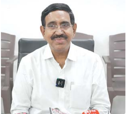
నెల్లూరు, మేజర్ న్యూస్ : నిరుపేదలకు అతి తక్కువ రేట్లకే నాణ్యమైన ఆహారాన్ని అందజేసే

రాష్ట్ర మంత్రి నారాయణ వెల్లడి వాతావరణంలో అందించే అన్నా క్యాంపేన్ను ఆగస్టు 15 నుండి రాష్ట్రంలో ప్రారంభించనున్నట్లు మున్సిపల్ శాఖ మంత్రి డాక్టర్ వంగూరు నారాయణ తెలిపారు. గతంలో తమ ప్రభుత్వ హయాంలో 203 అన్నా క్యాంపేన్లు ప్రారంభించినప్పటికీ 183 క్యాంపేన్లు మాత్రమే ఫంక్షనింగ్ లోకి వచ్చాయని, వాటి ద్వారా రోజుకి దాదాపు 2.25 లక్షల మంది భోంచేసేవారని తెలిపారు. మిగిలిన 20 క్యాంపేన్లలో 18 క్యాంపేన్ల భవనాలు పూర్తవ్వగా, 2 క్యాంపేన్ల భవనాలు ప్రాథమిక దశలోనే నిలిచిపోయాయన్నారు. అయితే గత ప్రభుత్వం అన్నా క్యాంపేన్లు అన్నింటినీ