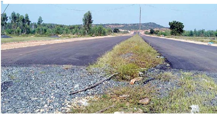
తారురోడ్లు వేసిన దృశ్యం

పారిశ్రామిక పార్కు ఏర్పాటు, ఒక పరిశ్రమ ఏర్పాటుకు అను మతి సాధించారు. ఇక్కడ రూ.28 కోట్లతో ఇండస్ట్రియల్ పార్కు పనులకు 2020 సెప్టెంబరులో గౌతంరెడ్డి శంఖుస్థాపన గావించారు. గౌతంరెడ్డి 2022 ఫిబ్రవరిలో గుండెపోటుకు గురై హఠాన్ మరణం పొందడం తెల్సింది. అయితే అంతకు ముందే ఆయన ఉండగానే దాదాపు 84 ఎకరాల భూమిని సప్తపరిహారం చెల్లించి సేకరించడం, ఇక్కడ సెంచర్ ఫైవుడ్ ఫ్యాక్టరీ ఏర్పాటు చేసేలా నిర్ణయించడం జరగా, ఈ పరిశ్రమను బద్వేలు ప్రాంతం తరలించిన ముఖ్యమంత్రి శంఖుస్థాపన కూడా గావించగా.. అక్కడ పనులు శరవేగంగా పూర్తవుతున్నాయి. మెట్ట ప్రాంతంలో ఐటీ శాఖ మంత్రి మేకపాటి గౌతంరెడ్డి ఒక పరిశ్రమ తెచ్చారు. తద్వారా ప్రత్యక్షంగా, పరోక్షంగా 15 వేల మందికి ఉద్యోగం, ఉపాధి అవకాశాలు లభిస్తాయని అందరూ గంపెదాశతో ఉండగా, ప్రభుత్వం నీళ్లు చల్లిందని సర్వత్రా విమర్శించారు. విస్తరలో పంచభక్త పరమా న్నాలు వడ్డించి నోటికాద నుండి లాక్కొన్న ట్టుగా ఉందని సర్వత్రా ఆవేదన వ్యక్తం చేశారు. కాగా గౌతంరెడ్డి హఠాన్ మరణం చెందడంతో ఇక అత్యుక్తారుకు పరిశ్రమలు రావడం గగనమని, పరిశ్రమ వచ్చిందని