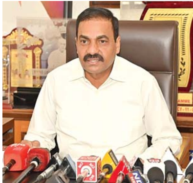
నాయకులపై కఠిన చర్యలు తీసుకొని ప్రజలకు రక్షణ కల్పించాలని డిమాండ్ చేశారు.