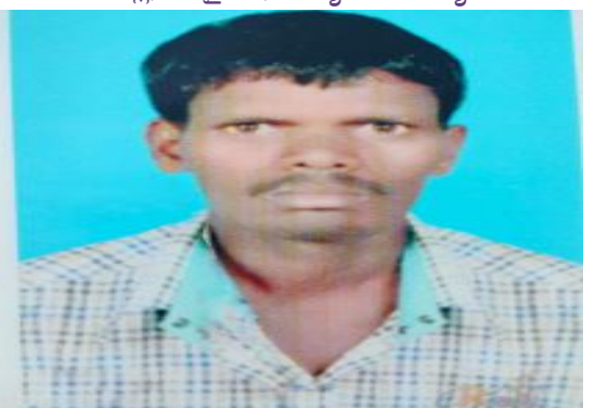
ఎడపల్లి, జూలై 17, సూర్య మేజర్ న్యూస్