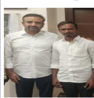
రాజంపేట్, జూలై 22, సూర్య మేజర్ స్కూల్స్