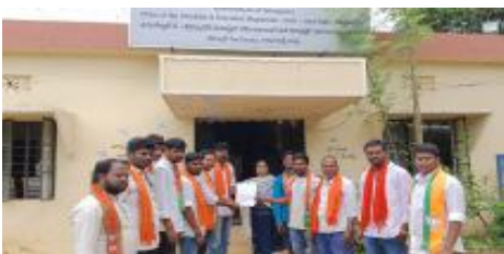
బీరూర్, జూలై 22, సూర్య మేజర్ స్కూల్స్

ముఖ్యమంత్రి రేవంత్ రెడ్డి తెలంగాణ రాష్ట్రంలో కాంగ్రెస్ ప్రభుత్వం అధికారంలోకి వచ్చిన వెంటనే బీ. సి లకు ఇచ్చిన హామీలను అమలు చేస్తామని, కామారెడ్డి సభలో బి. సి డిక్లరేషన్ ద్వారా హామీలు