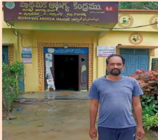
రాజా హన్మాజీపేట్ గ్రామస్థులు.

తూ మంత్రంగా ప్రభుత్వ హెల్త్ క్యాంపులు నిర్వహించినప్పటికీ ప్రయోజనం లేదని అంటున్నారు. గ్రామాల్లో రోజురోజుకు జ్వరంతో మొదలై కాళ్లు, చేతులు, కండరాలు, కీళ్ల వాపుల బాధతో కనీసం పైకి లేవ లేని పరిస్థితి ఉండటంతో మంచానికే పరిమితం అవుతున్నామని అంటున్నారు. ఇప్పటికైనా వైద్యాధికారులు దృష్టి సారించి విష జ్వరాల నుండి ఆయా గ్రామాల ప్రజలను కాపాడాలని ప్రజలు కోరుతున్నారు.