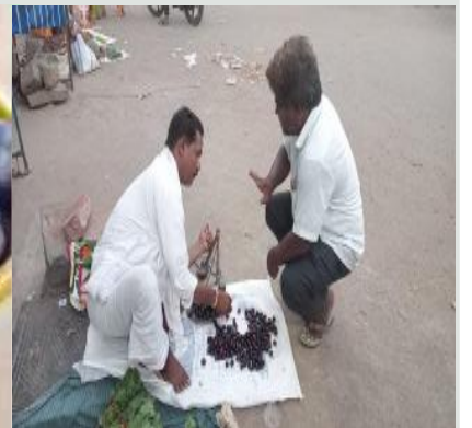
ఎల్లారెడ్డి, జూలై 05, సూర్య మేజర్ న్యూస్

సంపూర్ణ ఆరోగ్యానికి దివ్య ఔషధంలా అల్లనేరేడు పండ్లు ఒక ఉదాహరణ గా చెప్పవచ్చు వివిధ రకాల ఆయుర్వేద చెట్లనుండి ఔషధ తయారీకి అల్లనేరేడు పళ్ళు ఉపయోగిస్తారని అంటారు. అల్ల నేరేడు మధుమేహానికి, రక్తపోటుకు, సుగర్ వ్యాధి గ్రస్తులతో పాటు వివిధ వ్యాధిగ్రస్తులకు దివ్య ఔషధంలా పనిచేస్తుంది. ప్రాచీన కాలం నుండి అల్లనేరేడు పండ్లు ఆరోగ్యానికి మేలు చేస్తాయని ప్రాచీన వైద్యులు తమ వైద్యశాస్త్రంలో తెలియజేసినట్లు చాలామంది ఆయుర్వేద వైద్యులు చెప్తుంటారు. ముఖ్యంగా అల్లనేరేడు పండ్లు వర్షాకాలం మొదలయ్యే నాటికి లభ్యమవుతాయి ఎల్లారెడ్డి డివిజన్ లోని ఎల్లారెడ్డి లింగంపేట్, గాంధారి అడవులలో లభ్యమవుతాయి. ఆయా మండలాల్లో అల్ల నేరేడు చెట్లు ఎక్కువగా ఉండడంతో, అడవిలో నివసించే లంబాడీల తెగ ఈ అల్లనేరేడు పండ్ల ను పట్టణ ప్రాంతాలకు తరలించి అమ్ముతుంటారు. గతంలో చాలా తక్కువ ధరకే లభిస్తూ ఉండేవి. రాసు రాసు ఆయుర్వేద డాక్టర్లు ఆరోగ్యానికి మేలు చేస్తాయని తెలియజేయడంతో గిరాకీ బాగా పెరిగింది. గతంలో ఈ పండ్లను తినేవారు లేక చెట్లపై నుండే కిందికి రాలిపడి వృధాగా పోయేవని, కానీ ఈ మధ్యకాలంలో ఏ పత్రిక చూసిన అల్లనేరేడు పండ్లు అల్లోపతి నుండి ఇంగ్లీష్ వైద్యుల వరకు అల్ల నేరేడు పండ్లు తింటే నివారించవచ్చని తెలియజేస్తున్నారు. ఎండాకాలం నుండి వర్ష కాలం వరకు విరివిగా దొరుకుతాయి. అల్ల నేరేడు పండ్లు గురించి పలు పత్రికల్లో, టీవీలో కథనాలు రావడం దాంతో వీటికి మరింత డిమాండ్ పెరిగిందని, నిన్న మొన్నటి వరకు 20 రూపాయల కిలో చొప్పున ఉన్న అల్లనేరేడి పండ్లు ఇప్పుడు ఏకంగా 80 రూపాయల నుండి 100 రూపాయలకు కిలో చొప్పున అమ్ముడు పోతాయని అన్నారు. అల్ల నేరేడు ఎంతమక్కితే అంత