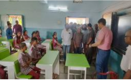
మాచారెడ్డి, సూర్య మేజర్ స్కూల్స్, జూలై 05