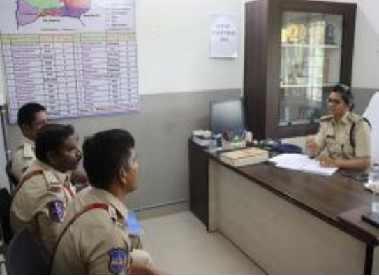
కామారెడ్డి జ్యూరీ, సూర్య మెజర్ న్యూస్, జూలై 05

వారిక తనిఖీలో భాగంగా శుక్రవారం రోజున దేవునిపల్లి పోలీస్ స్టేషన్ ను తనిఖీ చేసిన జిల్లా ఎస్పీ సింధు శర్మ. అనంతరం పోలీసులకు పలు సూచనలు సలహాలు చేశారు. పోలీస్ స్టేషన్లు వచ్చే బాధితులకు తక్షణమే న్యాయం జరిగేలా కృషి చేయాలని, పోలీస్ స్టేషన్ అధికారుల సిబ్బంది పనితీరు బేష్ అని కితాబు ఇచ్చారు. శుక్రవారం తనిఖీలో భాగంగా దేవునిపల్లి పోలీస్ స్టేషన్ తనిఖీ చేయగా ప్రజలకు మరింత చేరువయ్యేలా పోలీసులు విధులు నిర్వహించాలని, ప్రజా సమస్యల పైన వెంటనే స్పందిస్తూ బాధితులకు సత్వరనయం