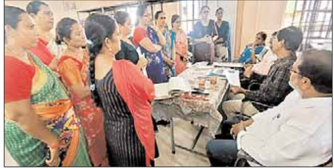
తోడు వ్యాపార నిర్వహణ కష్టంగా మారింది. అందువల్లనే మహిళామార్చ్ సత్కారాన్ని పట్టుకొని భావిస్తున్నానని అన్నారు. పొదుపు సంఘాలతో సహావేకాలు నిర్వహించాలని, అనంతరం కమిటీ సభ్యులు 'మహాసభ' తీర్మానాలను పురపాలక కమిషనర్ ద్వారా తమకు అందించాలని సూచించారు. మార్చ్ నిర్వహించాలన్నా, మూతపడేయాలన్నా మహిళలదే తుది నిర్ణయంగా వెల్లడించారు. ఏది ఏమైనా పాఠకులు జరిగినట్లు రుజువు అయితే మాత్రం సంబంధిత వ్యక్తులపై చర్యలు తీసుకుంటామని హెచ్చరించారు.

అద్దంకి, మేజర్ న్యూస్: మహిళలు సమిష్టిగా చేపట్టిన మార్చ్ నిర్వహణలో లోపించిన సమన్వయమే పూర్తి వైఫల్యం కారణమని చీరాల ఆర్డీవో జి. సూర్యనారాయణ రెడ్డి అన్నారు. అద్దంకి మెప్పా ఆధ్వర్యంలో నిర్వహిస్తున్న మహిళామార్చ్ గతనెలలో మూసిన విషయం పాఠకులకు విదితమే. అనంతరం మహిళామార్చ్ నిర్వహణలో తలెత్తిన లోపాలపై పాలక కమిటీ సభ్యులు జిల్లా కలెక్టర్ కు నివేదించారు. కలెక్టర్ ఆదేశాల మేరకు చీరాల ఆర్డీవో సూర్యనారాయణరెడ్డి, జిల్లా సహకారాధికారి శ్యాంసన్, డీఎల్ఐవో సువార్త, అద్దంకి పురపాలక కమిషనర్ ఎం. సత్యనారాయణ శనివారం విచారణ చేపట్టారు. పలు విషయాలను కమిటీ సభ్యులు, ఆర్డీలు అధికారుల దృష్టికి తీసుకువచ్చారు. తమపై నమ్మకంతో మహిళామార్చ్కు పెట్టుబడినిధులు సమకూర్చారని, ఇందులో ఏం జరుగుతోందో తెలియజేసే బాధ్యత తమపై ఉందన్నారు. కేవలం సీఎంఎం ఏకపక్ష నిర్ణయాల కారణంగానే మార్చ్ మూతపడే స్థితికి చేరిందని వాపోయారు. ఎక్కవ మంది సభ్యులు తమ పెట్టుబడి వెనక్కు ఇవ్వాలని డిమాండ్ చేస్తున్నారని, ఈ కారణంగా తాము మార్చ్ నిర్వహించలేమని తేల్చి చెప్పారు. ఇదే సమయంలో సీఎంఎం కూడా తాము నిర్వహించిన లావాదేవీలన్నిటికీ పత్రాలు ఉన్నట్లు ఆధారాలు చూపించారు. ఆమెరకు ఆర్డీవో మాట్లాడుతూ దస్త్రాలనిర్వహణలో వైఫల్యం కొట్టొచ్చినట్లు కనిపిస్తుందని, ఏకపక్ష నిర్ణయాల కారణంగా మహిళాసభ్యుల మధ్య అంతరాలు పెరిగాయన్నారు. దీనికి