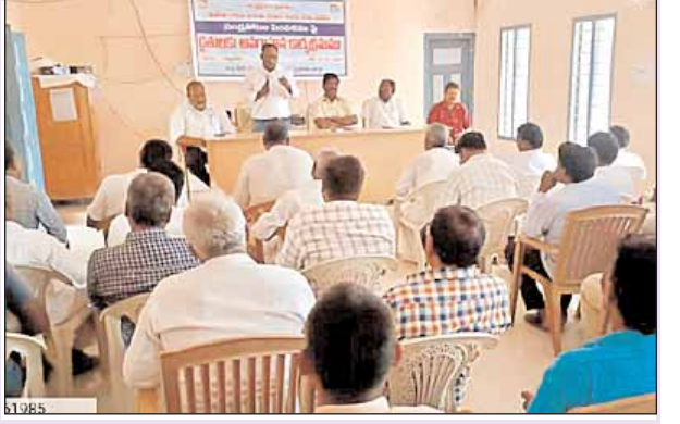
చిన్న కొండయ్య, ఇంజనీరింగ్ కన్సల్టెంట్ పెద్దయ్య, డెక్లికల్ అసిస్టెంట్లు పాల్గొన్నారు.