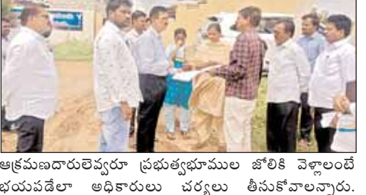
ఆక్రమణదారులెవ్వరూ ప్రభుత్వభూముల జోలికి వెళ్లాలంటే భయపడేలా అధికారులు చర్యలు తీసుకోవాలన్నారు. ఎప్పటికప్పుడు రెవిన్యూ సిబ్బంది ఇలాంటి వాటిపై దృష్టి సారించాలన్నారు. భూములను ఆక్రమించేందుకు సిద్ధం చేసుకున్న మెటేరియల్ ను తక్షణం రెవిన్యూ, పురపాలక కార్యాలయాలకు తరలించాలన్నారు. ఇంటి నంబరు, విద్యుత్తు మీటర్లు ఇవ్వద్దన్నారు. శింగరకొండ వద్ద గతంలో స్టాన్ క్రాఫర్ కు కేటాయించిన ఐదుఎకరాల భూమిని నామ్ ఎక్స్ ప్రెస్ రహదారి నుంచే పరిశీలన చేశారు.