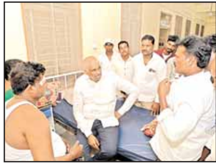
సరేంద్ర వర్మ రాజు బుధవారం పరామర్శించారు. ఈ సందర్భంగా ఆయన మాట్లాడుతూ నియోజకవర్గంలో

బాపట్ల టౌన్, మేజర్ న్యూస్: పచ్చని పల్లెల్లో వివాదాలు సృష్టించాలని చూస్తే సహించేది లేదని, ఎన్నికల సమయంలోనే పార్టీల నాయకులు రాజకీయం చేయాలని ఎన్నికల అయిపోయిన అనంతరం అన్ని పార్టీల కార్యకర్తలు నాయకులు కలిసి మెలిసి స్నేహ బంధంగా ఉండాలని, గొడవలకు దూరంగా ఉండాలని అన్నారు బాపట్ల ఎమ్మెల్యే వేగేశన సరేంద్ర వర్మ రాజు. బాపట్ల మండలం పోతురాజు కొత్తపాలెం టిడిపి నాయకులు మొక్కలు తీర్చుకునే క్రమంలో వైసిపి నాయకులు టిడిపి నాయకులపై దాడులు చేయడంతో టిడిపి నాయకులకు తీవ్ర గాయాలు అయ్యాయి. బాపట్ల ఏరియా వైద్యశాలలో చికిత్స పొందుతున్న టిడిపి నాయకులైన క్షతగాత్రులను బాపట్ల ఎమ్మెల్యే