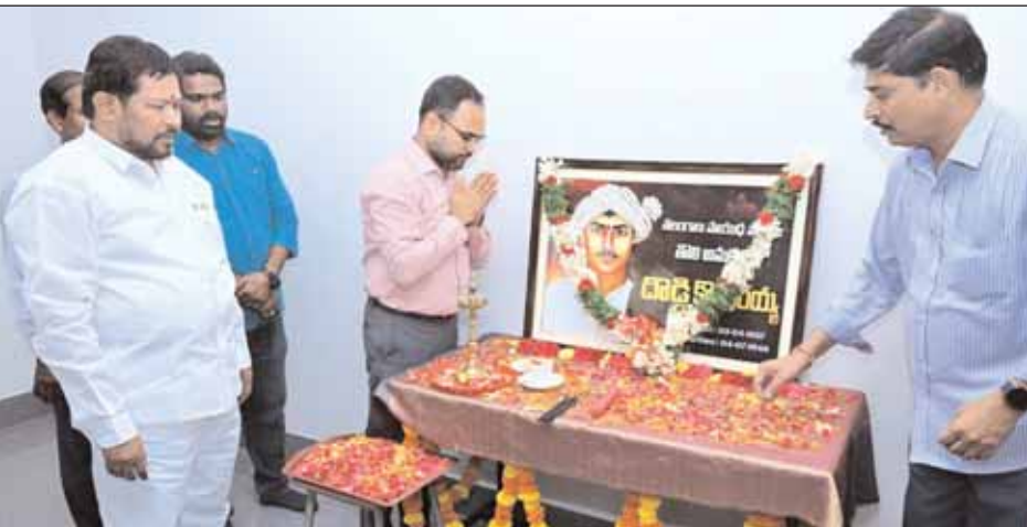
రంగారెడ్డి జిల్లా ప్రతినిధి, మేజర్ న్యూస్ (జూలై 04) : తెలంగాణ లైతాంగ సాయుధ పోరాట యోధుడు దొడ్డి కొమరయ్య స్ఫూర్తిని కొనసాగించాలని రంగారెడ్డి జిల్లా కలెక్టర్ శశాంక అన్నారు. కొమరయ్య జయంతి, వర్తంతి కార్యక్రమాలను అధికారికంగా నిర్వహించాలనే ప్రభుత్వం ఆదేశాలను అనుసరిస్తూ... మిగతా 2లో