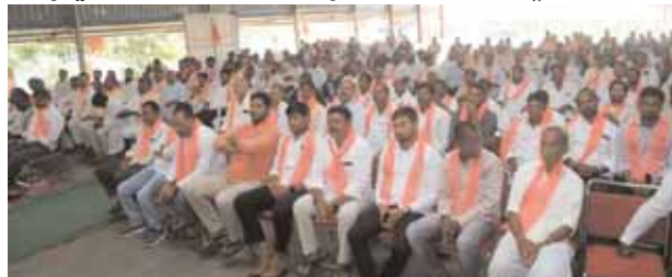
సమావేశంలో పాల్గొన్న పార్టీ నాయకులు