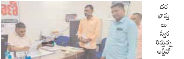
దరఖాస్తులు స్వీకరిస్తున్న ఆర్డీవో