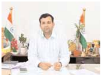
కలెక్టర్ ప్రతీక్ జైన్.

మున్సిపల్ పట్టణాలతో పాటు, అన్ని మండల కేంద్రాలలోని ఎంపీడిఓ కార్యాలయాలలో ప్రజా పాలన సేవా కేంద్రాలు అందుబాటులో ఉన్నాయని ఆయన తెలిపారు. వివిధ పనుల నిమిత్తం, సమస్యలు విన్నవిస్తూ అర్జీలు