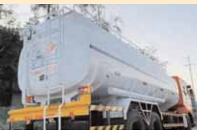
అధికారులు సీజ్ చేసిన కల్తీ డిజిల్ ట్యాంకర్

నందిగామ, మేజర్ న్యూస్ (జూలై 20): నందిగామ మండల పరిధిలోని అపెక్స్ బయో డిజిల్, సీతల్ ఫ్యాక్టరీ నుండి కల్తీ డిజిల్ తరలిస్తున్నట్లు అందిన విశ్వసనీయ సమాచారం మేరకు శుక్రవారం రాత్రి సివిల్ సప్లయ్ అధికారులు, విజిలెన్స్ అధికారులు,