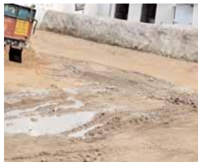
నివాస ప్రాంతాల్లో నిలిచిపోయిన వరప్తు నీరు.