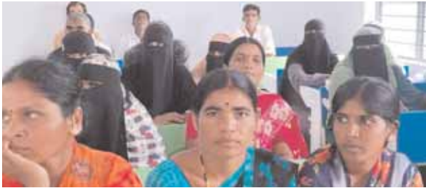
సమావేశంలో హాజరైన విద్యార్థుల తల్లిదండ్రులు.