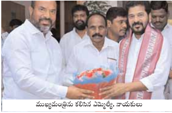
ముఖ్యమంత్రిను కలిసిన ఎమ్మెల్యే, నాయకులు

చేవెళ్ల, మేజర్ న్యూస్ (జూలై 20): చేవెళ్ల అభివృద్ధికి నిధులు మంజూరు చేయాలని చేవెళ్ల ఎమ్మెల్యే కాలే యాదయ్య శనివారం ముఖ్యమంత్రి రేవంత్ రెడ్డిని మర్యాదపూర్వకంగా కలిసి పుష్పగుచ్ఛం అందించి శాలువాతో సన్మానించారు. అదేవిధంగా డా.బీఆర్ అంజేద్ దుర్ సచివాలయంలో తెలంగాణ రాష్ట్ర ప్రభుత్వ సలహాదారులుగా ప్రమాణస్వీకారం చేసిన కె.కేశవరావును మర్యాదపూర్వకంగా కలిసి శుభాకాంక్షలు తెలియజేశారు. ఆయన వెంట చేవెళ్ల మాజీ జడ్పీసీ మర్పల్లి మాలతికృష్ణారెడ్డి, మాజీ సర్పంచ్ బల్లంత్ రెడ్డి తదితరులు ఉన్నారు.