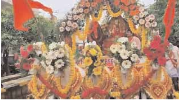
తాండూరులో ఘనంగా సాగిన సాయిబాబా రథ యాత్ర.