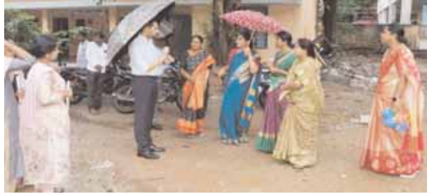
విద్యార్థుల తల్లిదండ్రులతో మాట్లాడుతున్న జిల్లా కలెక్టర్

పాఠశాల ఉపాధ్యాయులతో మాట్లాడుతున్న జిల్లా కలెక్టర్ మేడ్చల్, మేజర్ న్యూస్ (జూలై 20) : ప్రభుత్వం అమలు చేస్తున్న గృహజ్యోతి, మహాలక్ష్మి పథకాలను అర్జులైన ప్రతి కుటుంబానికి అందించాలని మేడ్చల్-మల్కాజిగిరి జిల్లా కలెక్టర్ గౌతం పోత్రు అధికారులను ఆదేశించారు. ఈ సందర్భంగా ఆయన మేడ్చల్ పట్టణంలోని మండల పరిషత్ కార్యాలయంలో ఏర్పాటు చేసిన ప్రజాపాలన కేంద్రాన్ని శనివారం ఆకస్మికంగా తనిఖీ చేసి ఇప్పటి వరకు నమోదైన దరఖాస్తులను పరిశీలించారు. అనంతరం ఆయన ప్రజాపాలనలో ఎన్ని దరఖాస్తులు వచ్చాయని సంబంధిత శాఖల అధికారులను అడిగి వివరాలు తెలుసుకున్నారు. ఈ సందర్భంగా జిల్లా కలెక్టర్ గౌతం పోత్రు మాట్లాడుతూ ప్రజాపాలనలో వచ్చిన దరఖాస్తులను ఎప్పటికప్పుడు ఆన్లైన్లో నమోదు చేయాలన్నారు. ప్రజాపాలనలో దరఖాస్తు చేసుకున్న లబ్ధిదారులకు అందించిన గృహజ్యోతి, మహాలక్ష్మి పథకం విజయవంతంగా