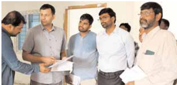
అభివృద్ధి పనుల గురించి అధికారులతో అడిగి తెలుసుకుంటున్న

కొడంగల్, మేజర్ న్యూస్ (జూలై 20): కొడంగల్ మున్సిపల్ లో జరుగుతున్న అభివృద్ధి పనులను వికారాబాద్ జిల్లా కలెక్టర్ ప్రతీక్ జైన్ శనివారం ఆకస్మికంగా పర్యటించి తనిఖీ చేశారు. కొడంగల్ పట్టణంలోని హనుమాన్ దేవాలయం సమీపంలోని వడ్డెరగల్లి ఓ కుటుంబ సభ్యులతో కలెక్టర్ మాట్లాడుతూ గృహజ్యోతి పథకంలో జీరో విద్యుత్ బిల్లు వస్తుందా, గ్యాస్ సిలిండర్ సబ్సిడీపై అడిగి తెలుసుకున్నారు. జీరో బిల్లు వస్తుందని లబ్ధిదారులు తెలపగా గ్యాస్ సిలిండర్ సబ్సిడీకి సంబంధించి బ్యాంకు ఖాతాలో చూసుకోవాలని తెలిపారు. అరులైన లబ్ధిదారులకు గృహజ్యోతి పథకం వర్తించేలా అధికారులు చర్యలు తీసుకోవాలని ఆదేశించారు. అదే విధంగా నూతనంగా నిర్మిస్తున్న మున్సిపాలిటీ భవనాన్ని పరిశీలించి పనులను వేగవంతం చేయాలని అధికారులను ఆదేశించారు. కొడంగల్ మున్సిపల్ లో జరుగుతున్న వివిధ అభివృద్ధి పనుల