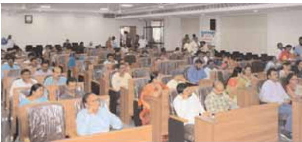
ప్రజావాణిలో పాల్గొన్న నాయకులు