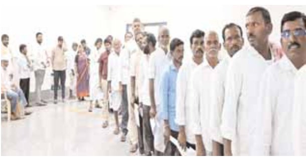
ప్రజావాణిలో ఫిర్యాదు చేసేందుకు బారులు తీరిన ప్రజలు

మొదటిపేజీ తరువాతి... సోమవారం కలెక్టరేట్ లోని సమావేశ మందిరంలో జరిగిన ప్రజావాణి కార్యక్రమంలో వివిధ ప్రాంతాలకు చెందిన ప్రజలు 178 మంది దరఖాస్తులను స్వీకరించారు. ప్రజావాణి దరఖాస్తులను వెంటనే పరిష్కరించాలని సంబంధిత శాఖల అధికారులకు ఆదేశించారు. ప్రజావాణి కార్యక్రమంలో వచ్చిన 178 అర్జీలలో భూ సర్వే, పెన్షన్, ఇతర భూ సమస్యలకు సంబంధించినవి, ఇతర శాఖలకు సంబంధించినవి దరఖాస్తులు వచ్చాయని కలెక్టర్ తెలిపారు. సంబంధిత శాఖల అధికారులు అర్జీలపై ప్రత్యేక దృష్టి సారించి వెంట వెంటనే పరిష్కారం చేయాలని సూచించారు. ఈ కార్యక్రమంలో జిల్లా అదనపు కలెక్టర్లు (రెవిన్యూ)లింగాయ్ నాయక్, సుధీర్ కుమార్, ట్రైని కలెక్టర్ ఉమా హారతి,వికారాబాద్ ఆర్డీవో వాసు చంద్ర, జిల్లా అధికారులు, తదితరులు పాల్గొన్నారు.