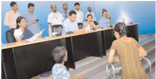
ఫిర్యాదులను స్వీకరిస్తున్న దృశ్యం.

మేడ్చల్ జిల్లా ప్రతినిధి, మేజర్ న్యూస్ (జూలై 22): ప్రజావాణి లో వచ్చిన అర్జీలను పరిశీలించి ఎప్పటికప్పుడు పరిష్కరించాలని సంబంధిత శాఖ అధికారులను మేడ్చల్ - మల్కాజిగిరి జిల్లా కలెక్టర్ గౌతం పోట్రా ఆదేశించారు.