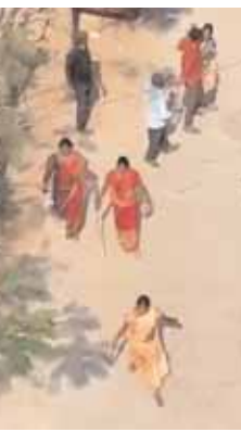
ఇబ్బందికరంగా మారిన లడ్జిలపై పోలీసులు చర్యలు చేపట్టాల్సిన అవసరం ఉందని పలువురు డిమాండ్ చేస్తున్నారు.

కామా తురానం న భయం న లజ్జ అన్నట్లుగా... కొందరు బరితెగించేస్తున్నారు. కామక్రీడలకు నిలయాలుగా మారిన లాడ్జిల్లో రాసలీలలు సాగిస్తున్నారు. పూట గడవడం కోసం కొందరు కామ వాంఛలు తీర్చుకునేందుకు... మరికొందరు ప్రేమో.. వ్యామోహమో తెలియని అయోమయంలో ఇంకొందరు తప్పటడుగులు వేస్తున్నారు. బ్యాగులు వేసుకొని కాలేజీ తరగతి గదుల్లోకి వెళ్లాలని టీనేజర్లు లాడ్జి మెట్లెక్కుడం కలవరపెట్టే అంశంగా మారింది. మేడ్చల్ పట్టణంలోని బస్టాండ్ వద్ద గత కొన్ని రోజుల వరకు ఆర్.కే లాడ్జి కొనసాగింది. అనుమానస్పద వ్యక్తులకు, వ్యభిచారులకు, విటులకు, జూదరులకు, మైనర్లకు గదులను అద్దెకు ఇవ్వకూడదనే నిబంధనలు ఉన్నప్పటికీ గతంలో ఆర్.కే లాడ్జి మాత్రం ఎలాంటి నిబంధనలు పాటించ లేదనే ఆరోపణలు ఉన్నాయి. నిబంధనలకు విరుద్ధంగా గుట్టుచప్పుడు కాకుండా ఆర్.కే లాడ్జిలో కొనసాగిన గలిజ్ దండాపై పోలీసులు ఉక్కుపాదం మోపగా మేడ్చల్ పట్టణంలో ఉన్న మరిన్ని లాడ్జిలపై చర్యలు తీసుకోవాలని లాడ్జిల వద్ద నివాసముంటున్న కుటుంబాలు అభిప్రాయపడుతున్నారు.