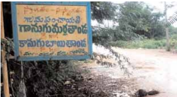
వర్షాలకు గోతులు, బురదమయంగా మారిన కానుగుబాయితాండ మట్టిరోడ్డు