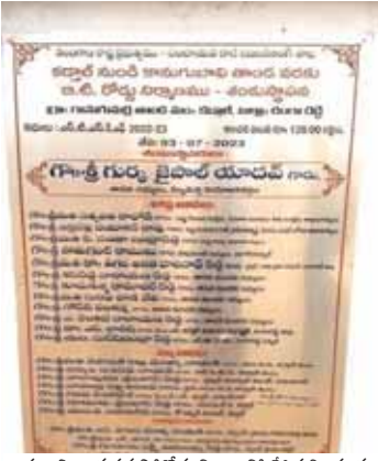
కానుగుబాయితాండ వద్ద బిటిరోడ్డు నిర్మాణానికి వేసిన శిలాఫలకం