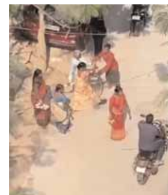
ఇబ్బందికరంగా మారిన లడ్జిలపై పోలీసులు చర్యలు చేపట్టాల్సిన అవసరం ఉందని పలువురు డిమాండ్ చేస్తున్నారు.