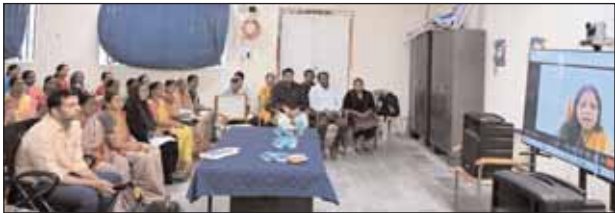
బొంబాయి, మేజర్ న్యూస్ (జూలై 24): గ్రామాల్లో ఇంటింటి సర్వేతో పిల్లల్లో అంగవైకల్యాన్ని గుర్తించాలని రాష్ట్ర స్త్రీ శిశు సంక్షేమ శాఖ కార్యదర్శి వాకాటి కరుణ తెలిపారు. బుధవారం బొంబాయి మండలాన్ని ఫైల్డ్ ప్రాజెక్టుగా ఎంపిక చేసి శారీరక వైకల్యంపై చేపట్టాల్సిన సర్వేపై ఏఎన్ఎం, ఆశా వర్కర్లు, అంగన్వాడీ