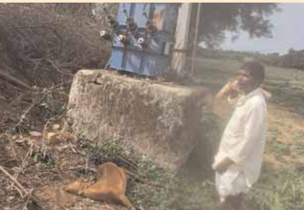
విద్యుత్ షాక్ తో మృతి చెందిన మేక