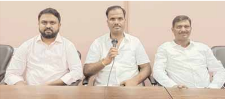
రంగారెడ్డి జిల్లా ప్రతినిధి(జూలై 10): ఉస్మానియా యూనివర్సిటీలో విధి నిర్వహణలో ఉన్న జర్నలిస్టులను అమానుశంగా పోలీసులు లాక్కేక్షడం అప్రజాస్వామికమని తెలంగాణ రాష్ట్ర వర్సింగ్ జర్నలిస్టుల సంఘం నాయకులు ఆవేదన వ్యక్తం చేశారు.