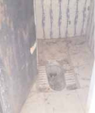
హరిజనవాడ ప్రభుత్వ పాఠశాల మరుగుదొడ్డు దుస్థితి.

కీసర, మేజర్ న్యూస్ (జూలై, 10): విరిగిన గేట్లు.. ఊడిన తలుపులు.. కంపు కొడుతున్న మరుగు దోడ్డు.. మూత్రశాలలు, చెత్తా చెదారంతో నిండుకున్న అవరణలు.. దుమ్ము పట్టిన బెంచీలు.. ఇది మేధ్యల్ మల్టాక్ గిరి గిరి జిల్లాలో ప్రభుత్వ పాఠశాలల దుస్థితి.. ప్రభుత్వం మారినా.. సమస్యలు మాత్రం అలాగే ఉన్నాయి. గత ప్రభుత్వం 'మన ఊరు.. మన బడి', ఇప్పటి కాంగ్రెస్ ప్రభుత్వం 'అమ్మ ఆదర్శ పాఠశాల' స్కీముల పేరిట సర్కారీ స్కూళ్ల అభివృద్ధి కోసం కోట్ల రూ.లు వెచ్చించిన బదుల స్థితి గతులు ఏ మాత్రం మారలేదు. నాసిరకం పనులతో కాంట్రాక్టర్లు, విద్యా శాఖ అధికారులు పర్యవేక్షణ లోపం వల్ల ప్రభుత్వ బదుల్లో సమస్యలు రాజ్యమేలుతున్నాయి. మౌలిక వసతులకు 12 కోట్లు మేధ్యల్ మల్టాక్ గిరి జిల్లాలో 375 ప్రభుత్వ పాఠశాలలు, 22 ప్రాథమికోన్నత పాఠశాలలు, 108 ఉన్నత పాఠశాలలు, 10 ఎయిడెడ్ పాఠశాలలు మొత్తం కలిపి 515 ప్రభుత్వ పాఠశాలలు ఉన్నాయి. కాంగ్రెస్ ప్రభుత్వం కొత్తగా ప్రవేశపెట్టిన 'అమ్మ ఆదర్శ పాఠశాల' స్కీమ్ లో భాగంగా ప్రభుత్వ పాఠశాలల్లో మౌలిక వసతుల కల్పనకు రూ. 12.01 కోట్లను కేటాయించారు. ఈ నిధులతో 286 ప్రభుత్వ పాఠశాలలో ఈ విద్యా సంవత్సరం అత్యవసర