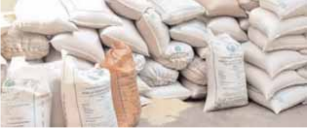
బ్లాక్ మార్కెట్లో రేషన్ బియ్యం. కుల్చర్ల మేజర్ న్యూస్(జూలై10):నిఘా వ్యవస్థ నిర్లక్ష్యం విజిలెన్స్ శాఖ నిఘా

లోపంతో నిరుపేదలకు అందవలసిన రేషన్ బియ్యం అడ్డదారిలో బహిరంగంగా మార్కెట్లో విరివిగా లభిస్తున్నాయి. నిరుపేదలకు అందవలసిన రేషన్ బియ్యం నల్లబజారుకు తరలిపోతున్నాయి. నిఘా వ్యవస్థ నిర్లక్ష్యంతో అక్రమ రేషన్ బియ్యం దండా మూడు పువ్వులు ఆరుకాయలుగా కొనసాగుతుంది. మండల వ్యాప్తంగా కొంతమంది వ్యాపారులు తక్కువ ధరకు బియ్యాన్ని కొనుగోలు చేసి ఎక్కువ ధరకు విక్రయిస్తున్నారు. మండల కేంద్రం లో బహిరంగంగా ప్రజలవద్ద నుండి, రేషన్ డీల్లర్ల వద్ద వ్యాపారస్తులు బియ్యాన్ని కొనుగోలు చేసి ఇతర ప్రాంతాలకు తరలిస్తున్నారు. నిఘా పెట్టవలసిన అధికార యంత్రాంగం వ్యాపారస్తులతో కుమ్మక్క కావడంతో డీల్లర్ అధికారులు వ్యాపారస్తులు సిండికేట్ గా మారి అక్రమ రేషన్ బియ్యం వ్యాపారాన్ని దర్జాగా కొనసాగిస్తున్నారు. అధికారులకు ఫిర్యాదు చేసిన పోలీసులకు సమాచారం ఇచ్చిన స్పందిస్తలేరని యువజన సంఘాల సభ్యులు ఆరోపిస్తున్నారు. వ్యాపారుల దుకాణంలో అక్రమంగా నిలువ ఉంచిన బియ్యాన్ని తమ పరిధిలోకి రాదని పోలీసు శాఖ వారు పేర్కొంటున్నారు. రెవిన్యూ శాఖ వారు సిబ్బందిలేక కార్యాలయ పనులు పూర్తి చేయలేకపోతున్నామని బాధపడుతున్నారు. అడ్డుకోవలసిన అధికార యంత్రాంగం విజిలెన్స్ శాఖ పట్టించుకోకపోవడంతో దర్జాగా, అటోలు బొంబో, డీసీఎం, బ్యూటీ అటోలలో రేషన్ బియ్యం తరలిపోతున్నాయి. ఉన్నత అధికారులు అక్రమ రేషన్ బియ్యం రవాణా విక్రయాలపై చర్యలు తీసుకోవాలని మండల ప్రజలు పేర్కొంటున్నారు.