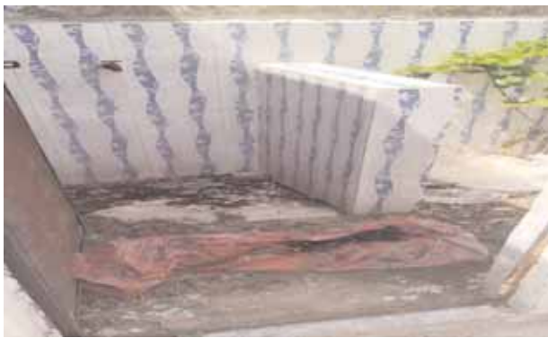
హరిజనవాడ ప్రభుత్వ పాఠశాల మరుగుదొడ్డు దుస్థితి.