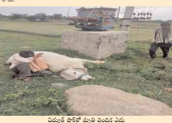
విద్యుత్ షాక్ తో మృతి చెందిన ఎద్దు