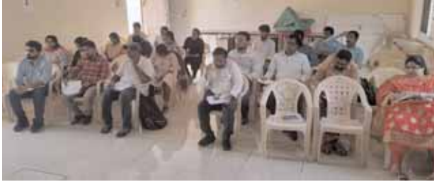
సమావేశంలో పాల్గొన్న వైద్యాధికారులు.

మొదటిపేజీ తరువాయి... అదే విధంగా తగినంత ఓఆర్ఎస్ పాకెట్స్ నిల్వలను ప్రాథమిక ఆరోగ్య కేంద్రాలలో ఉంచుకోవాలని ఆదేశించారు. వ్యాదుల నియంత్రణకు వివిధ శాఖల సమన్వయంతో పనిచేయాలని సూచించారు. ప్రస్తుతం చికిత్స పొందుతున్న అన్ని లిప్రసీ కేసులను ఆన్లైన్లో సమాచారం చేయాలని ఆదేశించారు. ముఖ్యంగా గర్భిణీలకు అన్ని రకాల సేవలు అందించి సాధారణ ప్రసవాలు జరిగేలా చూడాలని సూచించారు. నేడు జూలై 11న ప్రపంచ