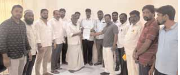
చెక్కును అందజేస్తున్న దృశ్యం. మోమిన్ పేట్, మేజర్ న్యూస్ (జూలై 10): ముఖ్యమంత్రి సహాయ నిధి పథకంతో నిరుపేద ప్రజలందరూ కార్పొరేట్ వైద్యం అంది విధంగా ముఖ్యమంత్రి రేపంత్ రెడ్డి శాసనసభ స్పీకర్ గడ్డం ప్రసాద్ కుమార్ ఆధ్వర్యంలో ప్రభుత్వం చర్యలు