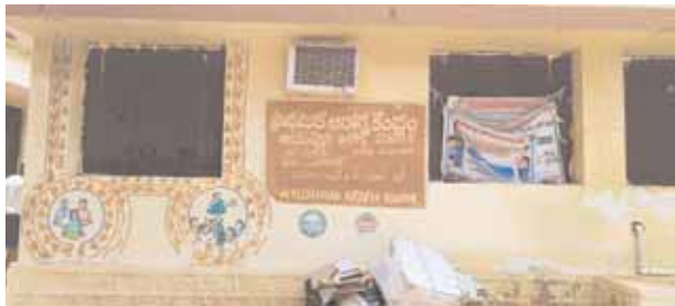
మండల కేంద్రంలోని ప్రాథమిక ఆరోగ్య కేంద్రం.

నవాబుపేట్, మేజర్ న్యూస్ (జూలై 16): మేడిపండు చూడు మేలిమై ఉండు పొట్టి విప్పి చూడు పురుగులుండు అనే నానుడి నవాబుపేట్ మండల కేంద్రంలోని సర్కారు దవఖానకు చక్కటి ఉదాహరణ. బయటకు మాత్రం నూతన రంగులతో మెరుపుల దిద్దిరే తప్ప... గత కొన్ని ఏళ్లుగా ఆస్పత్రి లోపల వర్షం పడితే లోపల ఉరుస్తూనే ఉంటుంది సమస్యను ప్రజాప్రతినిధులు, పై స్థాయి అధికారులు పరిష్కరించడంలో విఫలమయ్యారనే చెప్పవచ్చు. అందుకే ఈ వికారాబాద్ జిల్లా నవాబ్ పేట్ మండల కేంద్రంలోని ప్రాథమిక ఆరోగ్య కేంద్రం పరిస్థితి పైన పటారం లోన లోటారం అనే విధంగా దర్శనమిస్తోంది. గత బీఆర్ఎస్ ప్రభుత్వం సర్కారు దవఖానాల దశదశా మార్చేందుకు సన్నాహాలు చేస్తున్నామని చెబుతున్న మాటలు నీటి మూటలుగానే మిగిలిపోతున్నాయి. అందుకు నిదర్శనం వికారాబాద్ జిల్లా నవాబ్ పేట్ మండల కేంద్రంలోని ప్రాథమిక ఆరోగ్య కేంద్రం పరిస్థితి. గత దశాబ్ద కాలంగా అభివృద్ధికి నోచుకోవడం లేదు. నాటి నుంచి నేటి వరకు పాలకుల నిర్లక్ష్యానికి గురవుతూ శిథిలావస్థకు చేరుకుంది. ఆసుపత్రికి వచ్చే రోగులకు నాణ్యమైన వైద్య సేవలు అందించేందుకు అందుబాటులో ఉండే ప్రాథమిక ఆరోగ్య కేంద్రం