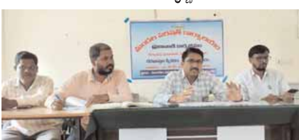
సమావేశంలో మాట్లాడుతున్న ఎంపీడివో.