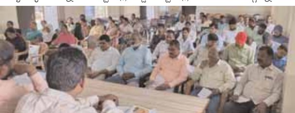
సమావేశంలో పాల్గొన్న అధికారులు.