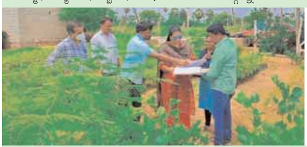
సర్పంచి 4 రికార్డులను పరిశీలిస్తున్న ఎంపిడిఓ