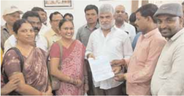
స్పీకర్ గడ్డం ప్రసాద్ కుమార్ కు వినతి

● రాష్ట్ర రవాణా శాఖ క్యాబినెట్ మంత్రి పొన్నం ప్రభాకర్, తెలంగాణ రాష్ట్ర సభాపతి గడ్డం ప్రసాద్ కుమార్ ను కలిసిన 2008 డీఎస్సీ డిఎడ్ అభ్యర్థులు