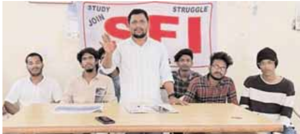
మేడిపల్లి మేజర్ స్కూల్స్ (జూలై 16): బోడుప్పల్ కాన్వేన్షన్ పరిధిలో ఉన్న కిరణ్ ఇంటర్నేషనల్ పాఠశాలలో విద్యార్థినిపై జరిగిన లైంగిక దాడిపై సమగ్ర విచారణ