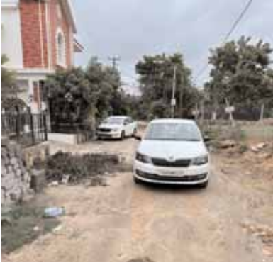
రోడ్డుకు అడ్డుగా నిలిపిన కారు

గండిపేట్, మేజర్ న్యూస్ (జూలై 16) : బండ్లగూడ జాగీర మున్సిపల్ కార్పొరేషన్ పరిధిలోని ఫీల్ గుడ్ హోమ్స్ లో ఉండే కొంత మంది ఆగడాలు రోజురోజుకు మితిమీరిపోతున్నాయని ప్రతాపరెడ్డి వెంచర్స్ వాసులు ఆవేదన వ్యక్తం చేస్తున్నారు. కార్పొరేషన్ పరిధిలోని ఫీల్ గుడ్ హోమ్స్ వారు ప్రతాపరెడ్డి వెంచర్స్ వైపు వెళ్లకుండా అడ్డు తగులుతున్నారని మండిపడ్డారు. ఈ మేరకు మంగళవారం బాధితులు మాట్లాడుతూ.. కార్పొరేషన్ లోని ఫీల్ గుడ్ హోమ్స్ లో ఉండే కొంత మంది వ్యక్తులు ప్రతాపరెడ్డి వెంచర్స్ లోకి వెళ్లకుండా తమ కార్లను అడ్డుగు పెడుతున్నారన్నారు. దీంతో ప్రతాపరెడ్డి వెంచర్స్ లోకి వెళ్లేందుకు ఇబ్బందులు