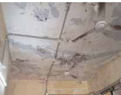
పెచ్చులుడుతున్న ఆసుపత్రి పై కప్ప.

నిధులు కేటాయింపులని నవాబ్ పేట్ మండల ప్రజలు కోరుతున్నారు.