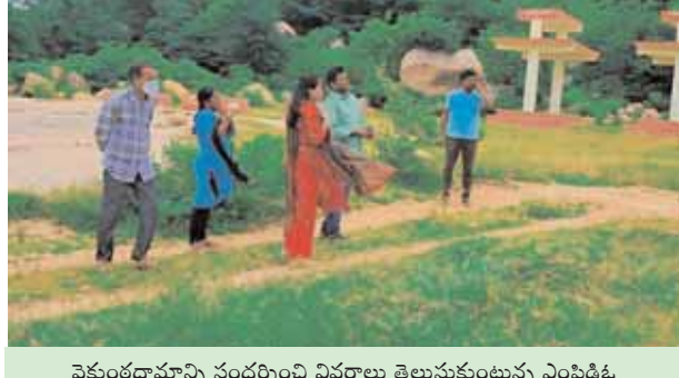
వైకుంఠధామన్ని సందర్శించి వివరాలు తెలుసుకుంటున్న ఎంపిడిఓ