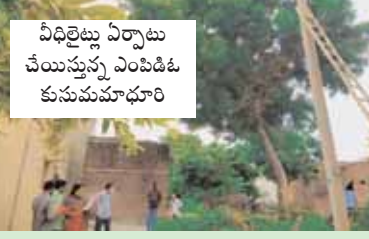
వీధిలైట్లు ఏర్పాటు చేయిస్తున్న ఎంపిడిఓ కుసుమమాధూరి