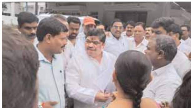
మంత్రి పొన్నం ప్రభాకర్ కు ఇస్తున్న వినతి

వికారాబాద్, మేజర్ న్యూస్ (జూలై 16): 2008 డీఎస్సీ లో క్యాబినెట్ అయిన ప్రైవేట్ డీఎడ్ అభ్యర్థులకు న్యాయం చేయాలని ప్రైవేట్ డీఎడ్ అభ్యర్థులు మంగళవారం నాడు హైదరాబాద్ లోని రవాణా శాఖ క్యాబినెట్ మంత్రి పొన్నం ప్రభాకర్ తెలంగాణ రాష్ట్ర సభాపతి గడ్డం ప్రసాద్ కుమార్ కలిసి ను కలిసి మొరారందం అందజేశారు అందజేశారు. ఈ సందర్భంగా అభ్యర్థులు మాట్లాడుతూ... గతంలో డీఎడ్ డిఎడ్ 2007, 2009, ప్రైవేట్ డీఎడ్ అభ్యర్థులు 2008 డీఎస్సీ లో వేలుపడిన నోటిఫికేషన్ లో ప్రభుత్వ డీఎడ్ అభ్యర్థులకు అవకాశం ఇచ్చారు కానీ ప్రైవేట్ డీఎడ్ అభ్యర్థులకు అవకాశం ఇవ్వాలని అప్పటి కాంగ్రెస్ ప్రభుత్వం ను కోరడం జరిగిందని కానీ ప్రభుత్వం తప్పిదం వల్ల ప్రభుత్వ డీఎడ్ అభ్యర్థులకు అవకాశం ఇచ్చారు. కానీ ప్రైవేట్ డీఎడ్ అభ్యర్థులకు 2008, డీఎస్సీలో అవకాశం ఇవ్వలేదని దీంతో అభ్యర్థులంతా కోర్టు ను ఆశ్రయించడం జరిగిందన్నారు. దీంతో అభ్యర్థులంతా కోర్టు ఆర్డర్ ద్వారా 2008, డీఎస్సీలో అభ్యర్థులు అందరూ పరీక్ష