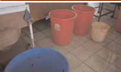
చెత్తబట్టలు, బకెట్లు పెట్టి రోగులకు చికిత్స అందిస్తున్న దృశ్యం.

నిధులు కేటాయింపులని నవాబ్ పేట్ మండల ప్రజలు కోరుతున్నారు.