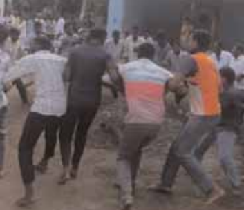
పీర్ల దగ్గర అలయ్ బలయ్ ఆడుతున్న యువకులు.

నిమజ్జనానికి వెళ్తున్న పిర్లు. చౌడపూర్, మేజర్ న్యూస్ (జూలై 17): చౌడపూర్ మండలంలోని మరికల్ గ్రామం లో బుధవారం మొహరం పండుగను హిందూ, ముస్లింలు కులాలకు అతీతంగా జరుపుకొన్నారు. నాలుగు రోజుల పాటు ప్రధాన కూడల్లో నిలబెట్టిన ఫీర్ల చుట్టూ అలయ్, బలయ్ ఆడుతూ.. పాటలు పాడారు. సాయంత్రానికి పీర్లను గ్రామంలో ఊరేగింపుగా నిమజ్జనానికి తరలి వెళ్లాయి. ఈ కార్యక్రమంలో గ్రామ పెద్దలు, యువకులు, తదితరులు పాల్గొన్నారు.