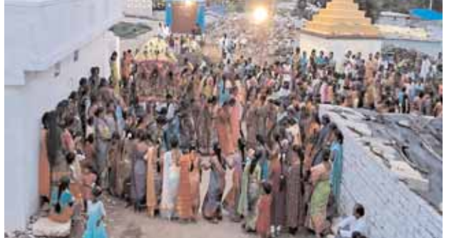
కొడంగల్ మండలంలో పీర్ల ఊరేగింపులో పాల్గొన్న మహిళలు