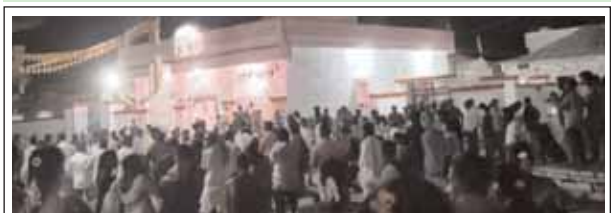
తాండూరు మండల పరిధిలోని గౌతాపూర్లో పీర్లపండుగను ఘనంగా జరుపుకుంటున్న గ్రామస్తులు.