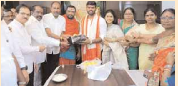
మేయర్ అజయ్ యాదవ్ కి శుభాకాంక్షలు తెలుపుతున్న కార్పొరేటర్లు.

★ బోడుప్పల్ కార్పొరేషన్ లో పచ్చదనం పెంపొందించాలి: నగర మేయర్ తోటకూర అజయ్ యాదవ్