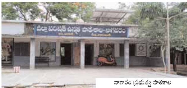
నాగారం ప్రభుత్వ పాఠశాల

ధారూర్, మేజర్ న్యూస్ (జూన్ 30): మండల పరిధిలోని నాగారం జిల్లా పరిషత్ ఉన్నత పాఠశాలలో వరుసగా దొంగతనాలు జరుగుతున్నాయి. అయితే ఈ దొంగతనాలు ఎవరు చేస్తున్నారు. ఇంతకు గ్రామస్థులు ఎవరైనా దొంగిలిస్తున్నారా? లేదా ఉపాధ్యాయుల హస్తం ఏమైనా ఉందా? అనే అనుమానాలు గ్రామ ప్రజలలో వ్యక్తం అవుతున్నాయి. గత నెల లో విద్యార్థులు ఆడుకునే ఆట వస్తువులను కిటికీలు, డోర్ పగలగొట్టి దొంగిలించినట్లు అలస్యంగా వెలుగు