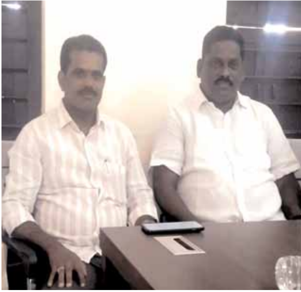
మండల కోఆర్డినేట్ సభ్యుడితో కలిసి ఎంపిటిసిల సమస్యలు వివరిస్తున్న కొత్త పాండుగౌడ్

మాడ్గల్, మేజర్ న్యూస్ (జూన్ 30): ఉమ్మడి ఆంధ్రప్రదేశ్ ప్రభుత్వాల హయాంలో ప్రతి ఎంపిటిసికి ప్రత్యేక నిధులు కేటాయించబడి గ్రామాభివృద్ధిలో భాగస్వామ్యం దక్కేదని, గడిచిన పదేండ్ల తెలంగాణ ప్రభుత్వం హయాంలో ఎంపిటిసిలకు