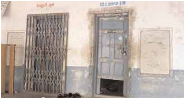
చోరుడు పగలగొట్టిన దృశ్యం

● దొంగతనానికి పాల్పడుతున్నది ఎవరు..? ● నెల రోజుల్లో రెండుసార్లు చోరీ