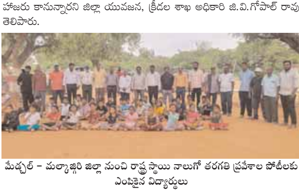
మేడ్చల్ - మల్కాజిగిరి జిల్లా నుంచి రాష్ట్ర స్థాయి నాలుగో తరగతి ప్రవేశాల పోటీలకు ఎంపికైన విద్యార్థులు

మేడ్చల్ జిల్లా ప్రతీనిధి, మేజర్ న్యూస్ (జూన్ 30): మేడ్చల్ - మల్కాజిగిరి జిల్లా నుంచి 21 మంది విద్యార్థులు రాష్ట్ర స్థాయి స్పోర్ట్స్ స్కూల్ పోటీలకు ఎంపికయ్యారు. ఇందులో, 13 మంది బాలురు, 8 మంది బాలికలున్నారు. తెలంగాణ స్పోర్ట్స్ స్కూల్ లో నాలుగో తరగతి ప్రవేశాల కోసం ఈ నెల 29న హాకీ పేట స్పోర్ట్స్ స్కూల్ లో ఎంపిక పోటీలు జరిగిన విషయం తెలిసింది. ఇందులో, మేడ్చల్ - మల్కాజిగిరి జిల్లాలోని అన్ని మండలాలు, మున్సిపాలిటీల నుండి ఎంపిక చేసిన అభ్యర్థులున్నారు. జిల్లా నుంచి ఎంపికైన 13 మంది బాలురు, 8 మంది బాలికలు జూలై 11న జరుగుతున్న రాష్ట్ర స్థాయి పోటీలకు