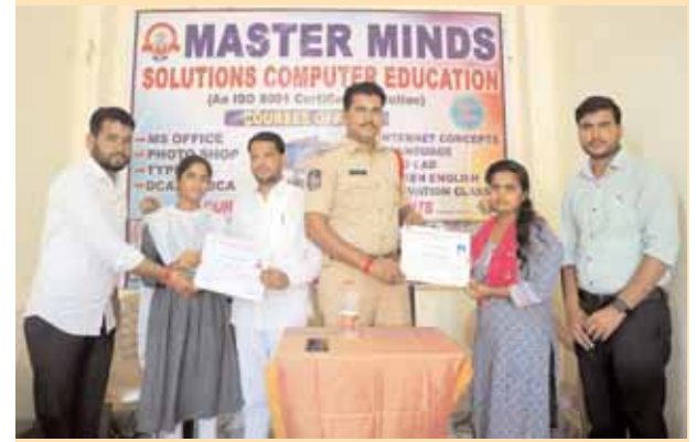
విద్యార్థులకు సర్టిఫికేషన్లు అందజేశారు.