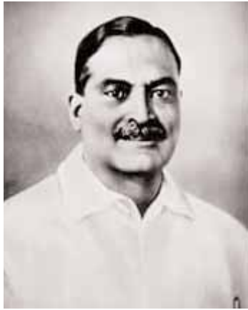
డాక్టర్: బి.సి. చంద్ర రాయ్

మేధుల్ జిల్లా ప్రతినిధి, మేజర్ న్యూస్ (జూన్ 30): మానవ సేవే మాధవ సేవ అనే నానుడివైద్యుల నుంచి వుట్టిందని గర్వంగా చెప్పవచ్చు. కనిపించని భగవంతునికి కంటే ఆరోగ్యం బాగుచేసే వైద్యుడినే భగవంతుని తో సమానంగా ప్రజలు ఆరాధిస్తారు. అలాంటి దర్శానికతకు నిలువెత్తు నిదర్శం బి సి రాయ్. అందుకే ఆయన చరిత్రలో చిరస్మరణీయులుగా చిరస్మాయిగా నిలిచారు. అలాంటి గొప్ప మహానభివృద్ధి అడుగుజాడలలో నడిస్తే జీవితానికి, వైద్య రంగానికి సార్థకత వుంటుందని వైద్యులు చెబుతున్నారు. పవిత్రమైన వైద్య వృత్తిని చేపట్టిన నేటి, రేపటి వైద్యులు, వైద్యులను ఆరాధిస్తున్న ప్రజల కోసం డాక్టర్స్ డే ప్రాముఖ్యత గురించి సూర్య ప్రత్యేక కథనం... ప్రజలకు నాణ్యమైన వైద్యం అందించాలనే మహోన్నతమైన సంకల్పంగల గొప్ప వ్యక్తి డాక్టర్: బి.సి. చంద్ర రాయ్ వైద్య పరంగనే గాక రాజకీయంగాను ప్రతిభను కనపరిచిన మానవతావాది గాను, ప్రజాశాఖిగా చెప్పవచ్చు. ఆయన జీవితంలో వైద్య, రాజకీయ రంగాల్లో ఎన్నో ఉన్నత పదవులను అధిరోహించారు. తన జీవితాన్ని వైద్యరంగానికి అంకిత మిచ్చిన మహోన్నత వ్యక్తి బి సి రాయ్ జన్మదినం, వర్తంతి సందర్భంగా వైద్యుల దినోత్సవం జరుపుకుంటున్నాం. అలాంటి మహోన్నత వ్యక్తిని గుర్తు చేసుకోవడం సముచితంగా