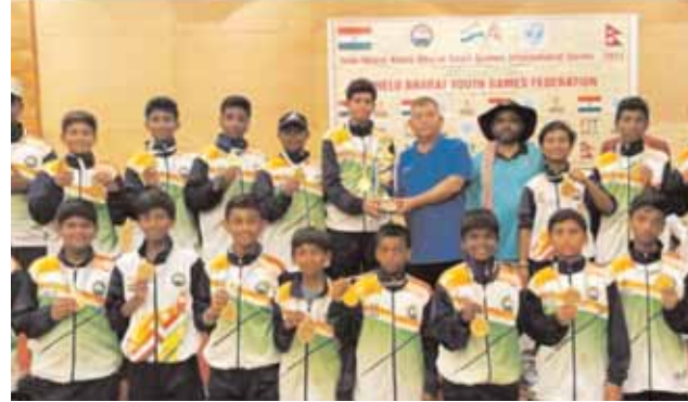
క్రీకెట్ పోటీలలో విజయం సాధించిన పల్లవి విద్యార్థులు