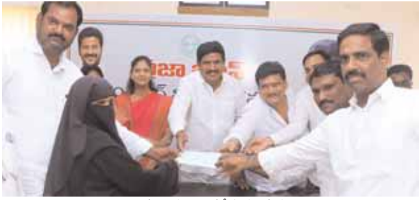
చెక్కులను అందజేస్తున్న దృశ్యం

తాండూర్ రూరల్ మేజర్ స్కూస్ (జూలై 01): తాండూరు ఎమ్మెల్యే క్యాంపు కార్యాలయంలో తాండూర్ మండలం వివిధ గ్రామాలకు చెందిన లబ్ధిదారులకు సోమవారం క్యాంపు కార్యాలయంలో కళ్యాణ లక్ష్మి షాధీ ముబారక్ చెక్కులను పంపిణీ చేసిన ఉమ్మడి రంగారెడ్డి జిల్లా ఎమ్మెల్సీ పట్నం మహేందర్ రెడ్డి, తాండూరు ఎమ్మెల్యే బుయ్యాయిని మనోహర్ రెడ్డి ఈ సందర్భంగా వారు మాట్లాడుతూ నిరుపేద కుటుంబాలకు అండగా కాంగ్రెస్ ప్రభుత్వం ఉంటుందని పేర్కొన్నారు తెలంగాణ రాష్ట్రంలో కాంగ్రెస్ ప్రభుత్వం ఏర్పడిన అనంతరం మహిళలకు పెద్దపీట వేస్తుందని సూచించారు ఆరు గ్యారెంటీ పథకాలలో భాగంగా మహిళలకు ఉచిత బస్సు సౌకర్యం అందించడం జరుగుతుందని