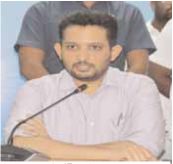
కలెక్టర్ గౌతం పోట్రా

నిర్వహించిన ప్రజావాణి కార్యక్రమానికి వివిధ ప్రాంతాల నుండి వచ్చిన అర్జీదారుల నుంచి అదనపు కలెక్టర్ విజయేందర్ రెడ్డి, లా ఆఫీసర్ చంద్రావతి తో కలిసి దరఖాస్తులను స్వీకరించారు. అనంతరం కలెక్టర్ గౌతం అధికారులనుద్దేశించి