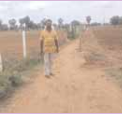
ఆక్రమణలతో ఇరుకుగా మారిన పకీరతాండ లింకు రోడ్డు

మాడ్చల, మేజర్ స్కూస్ (జూలై 01): మాడ్చల మండలం దొడ్లపహాడ్ - అప్పారెడ్డిపల్లి ప్రధాన రహదారి నుండి పకీరతాండ వరకు మహాత్మాగాంధీ జాతీయ ఉపాధహామి పథకం నిధులతో నిర్మించిన మట్టిరోడ్డు ఆక్రమణలతో కుచించుకుపోయి ద్విచక్రవాహనాల రాకపోకలకు సైతం ఇబ్బందిగా మారిందని వివిధ తాండాల ప్రజలు, వాహనదారులు వాపోతున్నారు. గత కొన్నేండ్ల కిందట 15 ఫీట్ల వెడల్పుతో నిర్మించిన ఈ మట్టిరోడ్డు ఆక్రమణలకు గురై దొడ్లపహాడ్ ప్రధాన రహదారి సమీపంలో ఇరువైపు పొలాల వారు రాత కడిలు పాతదంతో ఇరుకుగా మారిందని, సంబంధితశాఖల అధికారులు వెంటనే స్పందించి ప్రభుత్వ నిధులతో నిర్మించిన రహదారి ఆక్రమణలను తొలగించి రోడ్డును పునరుద్ధరించాలని వారు కోరుతున్నారు.