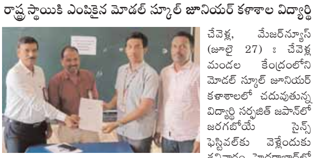
సైన్స్ ఇన్స్ట్రూర్ పరీక్ష రాయాగా జిల్లా మొదటి స్థానంలో నిలిచి రాష్ట్రస్థాయికి ఎంపికైనట్లు కళాశాల డిప్యూటీ డైరెక్టర్ తెలిపారు. ప్రభుత్వ పాఠశాలలో 10/10 జీసీఎ సాధించిన విద్యార్థులకు ఇన్స్ట్రూర్ స్కీం నుండి ఇది ఒక అద్భుత అవకాశమని ఇన్స్ట్రూర్ మనక్ అవార్డ్, ఎన్ఐఎఫ్, న్యూ డిజి వారి అధికారి మేరకు ప్రతి రాష్ట్రం నుండి నలుగురు విద్యార్థులు చొప్పున జపాన్ కు వెళ్ళేందుకు అవకాశం లభించిందని మా కళాశాల విద్యార్థి రాష్ట్రస్థాయికి ఎంపిక కావడం సంతోషంగా ఉందన్నారు.