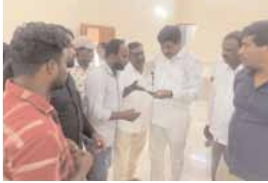
సమస్యను ఎమ్మెల్యేకు వివరిస్తున్న దృశ్యం

ప్రమాదవశాత్తు పడిపోయింది. విద్యుత్ అధికారులకు చెప్పిన పట్టించుకోవడం లేదని రైతులు అవేదన వ్యక్తం చేస్తున్నారు. మంగళవారం గ్రామ శివారులోని ఓ కార్యక్రమానికి వచ్చిన ఎమ్మెల్యే మనోహర్ రెడ్డికి ఎంపీటీసీ శాంతుతో కలిసి రైతులు విన్నవించుకున్నారు.