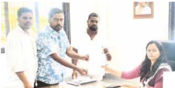
కలెక్టర్ కు వినతి