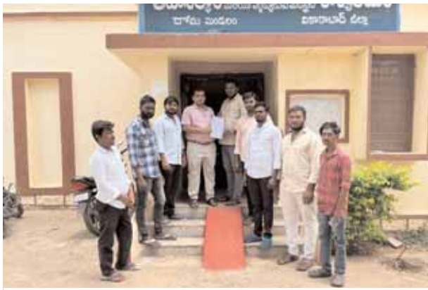
తహసీల్దార్ కు వినతి పత్రం అందజేస్తున్న దృశ్యం