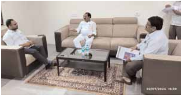
కొత్తూరు, మేజర్ న్యూస్ (జూలై 02): కొత్తూర్ మండలం సిద్ధాపూర్ గ్రామశివారులోని 342 ఎకరాల ప్రభుత్వ భూములపై వెంటనే సర్వే

★ జిల్లా కలెక్టర్ కు సిద్ధాపూర్ ప్రభుత్వ భూముల గోల్ మాల్ పై వివరించిన షాద్ నగర్ ఎమ్మెల్యే వీర్లపల్లి