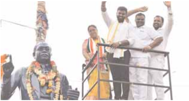
అంబేద్కర్ విగ్రహానికి పూలమాలవేసి అభిమానులకు అభివాదం చేస్తూ.