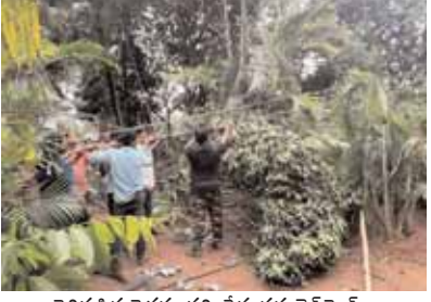
తెగిపడిన వైర్లను సరి చేస్తున్న లైన్ మెన్లు