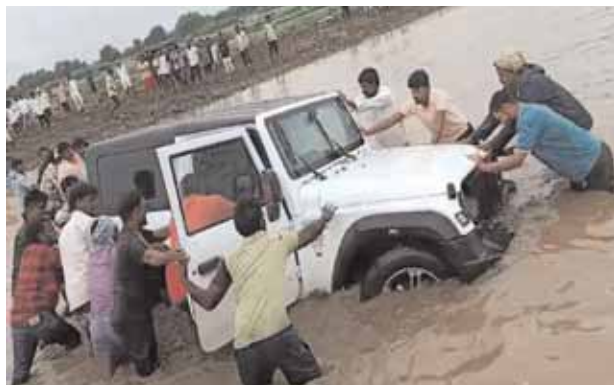
ప్రాజెక్టులో ఇరుక్కుపోయిన వాహనాలను బయటికి తారుతున్న నాగసముందర్ వాసులు