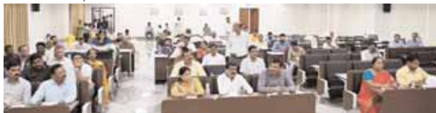
ప్రజావాణిలో పాల్గొన్న అధికారులు

వికారాబాద్ జిల్లా ప్రతినిధి, మేజర్ న్యూస్ (జూలై 15): ప్రజావాణి ఫిర్యాదులను పెండింగ్ ఉంచకుండా తక్షణమే పరిష్కరించాలని జిల్లా కలెక్టర్ ప్రతీక్ జైన్ అధికారులకు ఆదేశించారు. సోమవారం కలెక్టరేట్ సమావేశం హాలు నిర్వహించిన ప్రజావాణి కార్యక్రమంలో ప్రధానంగా విద్య, వైద్య, బిసి, గిరిజన సంక్షేమం, విద్యుత్, పంచాయతీ, పంచసభ, మున్సిపాలిటీ, ధరణి, మైన్స్, భూ సర్వే తదితర అంశాలకు సంబంధించి 84 ఫిర్యాదులు వచ్చాయి. వచ్చిన ఫిర్యాదులను ఆయా శాఖాధికారులకు అందజేస్తూ ప్రజావాణి ద్వారా స్వీకరించిన ఫిర్యాదులను వెంటనే పరిష్కరించాలని అధికారులను ఆదేశించారు. ప్రజావాణి తోపాటు ముఖ్యమంత్రి