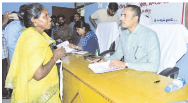
సోలూరు, జూలై 22, మేజర్స్ న్యూస్: ప్రజా సమస్యల పరిష్కారానికి అధికారులు ప్రాధాన్యత ఇవ్వాలని, మండల స్థాయిలోనే ఆయా ప్రాంత సమస్యల పరిష్కారం కావాలని అందుకు అధికారులు అనువైన చర్యలు తీసుకోవాలని తద్వారా అధికారులకు ఆర్థిక ఇబ్బందులు సమయ పాలన తగ్గుతాయని జిల్లా కలెక్టర్ ఎ. శ్యామ్ ప్రసాద్ తెలిపారు. ప్రజా సమస్యల పరిష్కార వేదిక కార్యక్రమంలో భాగంగా సోమవారం సోలూరు ఎం. పి. డి. బి. కార్యాలయం లో సంయుక్త కలెక్టర్ ఎన్ ఎస్ సోబిత, ఆర్ డి ఓ కే హేమలత్ లతో కలిసి ప్రజల నుండి అర్జీలు స్వీకరించారు. ప్రజలు పలు సామాజిక, వ్యక్తిగత సమస్యలకు పరిష్కారం కోరుకుంటూ అర్జీలు అందజేశారు. అర్జీ ల పరిష్కారం నిమిత్తం సంబంధిత అధికారులకు జిల్లా కలెక్టర్ ఆదేశాలు, సూచనలు మిగతా 2లో

-క్షేత్రస్థాయిలోనే వినతుల పరిష్కారానికి చర్యలు జరగాలి: జిల్లా కలెక్టర్ ఏ శ్యాం పసాద్