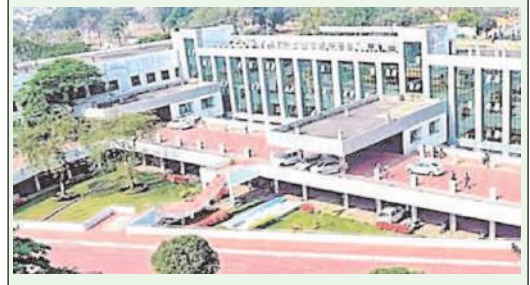
విశాఖపట్నం, జూలై 22, మేజర్స్ న్యూస్: మహా విశాఖపట్నం నగరపాలక సంఘం(జీవీఎంసీ) స్థాయి సంఘం ఎన్నికలను వచ్చే నెల 7వ తేదీన నిర్వహిస్తున్నట్లు జీవీఎంసీ ఇన్ చార్జ్ కమిషనర్, విశాఖపట్నం జిల్లా కలెక్టర్ ఎం.ఎన్. హరేంద్ర మిగతా 2లో

నోటిఫికేషన్ జారీ చేసిన జీవీఎంసీ ఇన్ చార్జ్ కమిషనర్ హరేంద్ర ప్రసాద్