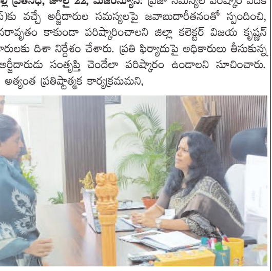
అనకాపల్లి ప్రతినిధి, జూలై 22, మేజర్స్ న్యూస్: ప్రజా సమస్యల పరిష్కార వేదిక (పీజీఆర్ఎస్)కు వచ్చే అర్జీలపై జవాబుదారీతనంతో స్పందించి, అర్జీలు పునరావృతం కాకుండా పరిష్కారించాలని జిల్లా కలెక్టర్ విజయ కృష్ణన్ జిల్లా అధికారులకు దిశా నిర్దేశం చేశారు. ప్రతి ఫిర్యాదుపై అధికారులు తీసుకున్న చర్యలతో అర్జీదారుడు సంట్కృతి చెందేలా పరిష్కారం ఉండాలని సూచించారు. పీజీఆర్ఎస్ అత్యంత ప్రతిష్టాత్మక కార్యక్రమమని, మిగతా 2లో

-జవాబుదారీతనంతో స్పందించాలి -జిల్లా అధికారులకు దిశా నిర్దేశం -జిల్లా కలెక్టర్ విజయ కృష్ణన్