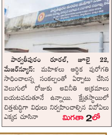
పార్వతీపురం రూరల్, జూలై 22, మేజర్స్ న్యూస్: మహిళలు ఆర్థిక పురోగతి సాధించాలన్న సంకల్పంతో ఏర్పాటు చేసిన వెలుగులో రోజుకు అవినీతి అక్రమాలు బయటపడుతున్నా ఉన్నాయి. క్షేత్రస్థాయిలో చిత్తకర్షణ విధులు నిర్వహించాల్సిన వివోఎలు ఎక్కడ చూసినా మిగతా 2లో

-వివోఎ లా అవకతవకలు -సంఘాల నుండి అధిక వసూళ్లు -రోడ్ ఎక్సీజ్ వెలుగు అవినీతి బాగోతం