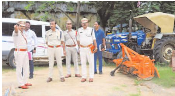
విజయనగరం క్రైమ్, జూలై 22, మేజర్స్ న్యూస్: జిల్లా ఎస్పీ శ్రీ వకుల్ జిందాల్, ఐపిఎస్ గారు జూలై 22న గజపతి నగరం, పెద మానాపురం, బూర్జువలన పోలీసు స్టేషనులను ప్రాంగణంలో గల వాహనాలు ఏ కేసుల్లో సీజ్ చేసినవి, ఎందుకు స్టేషను ప్రాంగణంలో ఉన్నవి అన్న విషయాలను అధికారులను అడిగి తెలుసుకున్నారు. సీజ్ చేసిన వాహనాలకు ఆయా కేసుల వివరాలను ట్యాగ్ చేయాలన్నారు. పోలీసు స్టేషను సిబ్బందితో మమేకపై, వారు నిర్వహించే విధులను అడిగి తెలుసుకున్నారు. స్టేషను రిస్పన్స్ రికార్డుల పరిశీలించి, స్టేషనుకు వచ్చే ఫిర్యాదుదారులతో మార్పిడిగా ప్రవర్తించాలని ఆదేశించారు. అనంతరం, స్టేషను రికార్డులు, సిడి ఫైల్స్ తనిఖీ చేసి, గ్రేడ్ కేసుల్లో దర్యాప్తును పరిశీలించారు. పోలీసు చేసారు. జిల్లా ఎస్పీ శ్రీ వకుల్ జిందాల్, ఐపిఎస్ గారు మిగతా 2లో

-విజయనగరం జిల్లా ఎస్పీ శ్రీ వకుల్ జిందాల్ -సైబరా నేరాలను ఛేదించేందుకు దర్యాప్తు అధికారులకు శిక్షణ ఇస్తాం -గంజాయి నియంత్రణకు ఆకస్మిక వాహన తనిఖీలు చేపట్టాలి