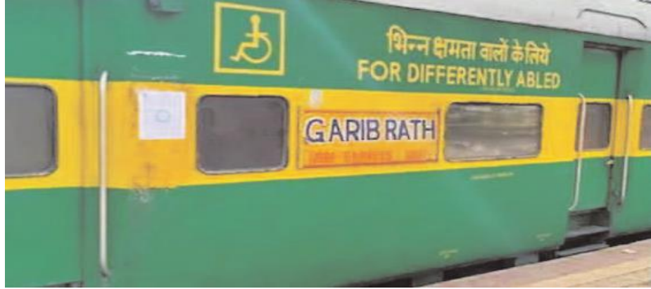
విశాఖపట్నం, జూలై 22, మేజర్స్ న్యూస్: అధునాతనమైన రాత్రి నుంచే ఈ బోగీలతో సికింద్రాబాద్ లో రైలు బయల్దేరి లింకే హాఫ్ మన్ బుష్ (ఎల్.హెచ్.బి) బోగీలతో గరిబరథ్ మంగళవారం ఉదయం విశాఖకు చేరనుంది. ఎక్స్ ప్రెస్ పరుగులు తీయనుంది. ఈ మేరకు సోమవారం ప్రయాణికులకు సౌకర్యం మిగతా 2లో