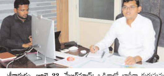
శ్రీకాకుళం, జూలై 22, మేజర్స్ న్యూస్: ఒడిశాలో భారీగా కురుస్తున్న వర్షాలతో ఎగువ నుండి నాగావళి, వంశధార నదులకు వచ్చి చేరుతున్న వరద నీటిపై ఇరిగేషన్ అధికారులు అప్రమత్తంగా ఉండాలని జిల్లా కలెక్టర్ స్వప్నీల్ దినకర్ పుండ్యర్ ఆదేశించారు. జాయింట్ కలెక్టర్ ఎం.ఎన్.హరేంద్ర కలిసి సోమవారం సాయంత్రం ఆయన జిల్లాలోని పలు ముఖ్య శాఖల అధికారులతో తన క్యాంప్ కార్యాలయంలో సమీక్ష నిర్వహించారు. ఈ సందర్భంగా జిల్లా కలెక్టర్ మాట్లాడుతూ భారీగా కురుస్తున్న వర్షాలతో నదీ ప్రవాహం ప్రమాద స్థాయిని దాటినట్లయితే గొట్ట వద్ద గేట్లను ఎత్తడానికి తగిన ఏర్పాట్లతో అధికారులు సిద్ధంగా ఉండాలని, లోతట్టు ప్రాంతాల ప్రజలను, అధికారులను అప్రమత్తం చేయాలని సూచించారు. ప్రధాన నదుల మిగతా 2లో

జిల్లా కలెక్టర్ స్వప్నీల్ దినకర్ పుండ్యర్