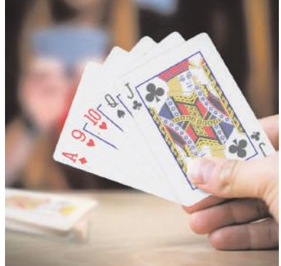
అనకాపల్లి, జూలై 22, మేజర్స్ న్యూస్: అనకాపల్లిలో ఒక జూదగృహంపై పోలీసులు దాడి చేయడం సంచలనం రేకెత్తించింది. జూదగృహంపై దాడి చేసి 27,500 నగదు, 7 సెల్ ఫోన్ లను స్వాధీనం చేసుకుని, పదిమంది జూదరులను అదుపులోకి తీసుకుని కేసునమోదు చేసారు. జూదగృహంపై దాడి చేయడం అప్పటి సహజమైన విషయమే కదా అనుకుంటే వచ్చులో కాలేసినట్లే దొరికిన నగదు 27 వేల రూపాయలే కదా మిగతా 2లో

-జూలు విదిల్చిన జిల్లా ఎస్పీ దీపిక -పోలీసులలో కలకలం