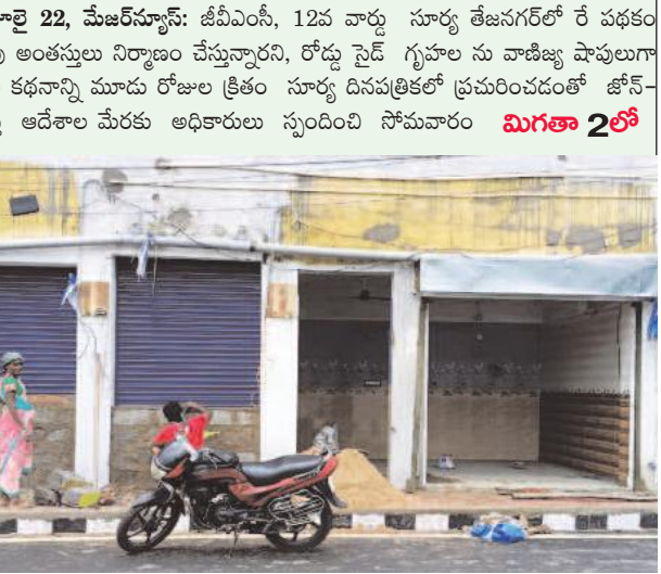
అరికేప, జూలై 22, మేజర్స్ న్యూస్: జీవీఎంసీ, 12వ వార్డు సూర్య తేజనగర్ లో రెడ ఫండ్ ఇళ్లపై అదనపు అంతస్తులు నిర్మాణం చేస్తున్నారని, రోడ్డు నైడ గృహాలను వాణిజ్య షాపులుగా మారుస్తున్నారని కథనాన్ని మూడు రోజుల క్రితం సూర్య దినపత్రికలో ప్రచురించడంతో జూన్-2 వినీసి శాల్మి ఆదేశాల మేరకు అధికారులు స్పందించి సోమవారం మిగతా 2లో

-గ్రౌండ్ ఫ్లోర్ లో దుకాణాలకే వేసిన తాళాలు లేకపోవడంతో.. అడ్డంగా గోడలు నిర్మాణం -సూర్య కథనానికి స్పందించిన అధికారులు