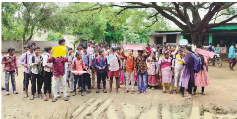
పార్టీ వారు అన్నారని ఎక్కడికో తీసుకెళ్ల నవనరం లేదని ముందు పాఠశాలకు ఉపాధ్యాయులను పంపమని ఎద్దేవా చేశారు. అన్ని రంగాల్లో కాంగ్రెస్ ప్రభుత్వం విఫలమైందని ఇప్పటికైనా కళ్లు తెరిచి