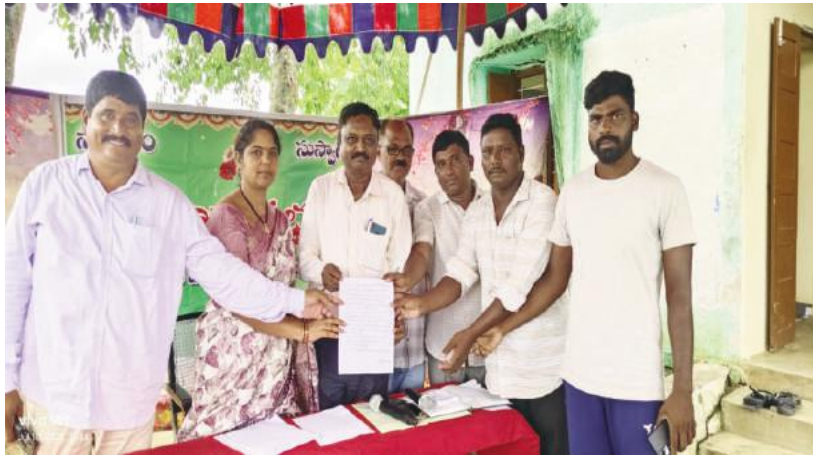
-సమస్యలతో కూడిన వినతి పత్రం అందజేసిన సిపిఐ నాయకులు

అశ్వాపురం,సూర్య (మేజర్ న్యూస్)- అశ్వాపురం గ్రామపంచాయతీ గ్రామసభ లో ఎంపీడివో, పంచాయతీ సెక్రెటరీ కి, సమస్యలతో కూడిన వినతిపత్రం అందజేసారు. ఈ సందర్భంగా సిపిఐ అశ్వాపురం కార్యవర్గ సభ్యులు మాట్లాడుతూ వర్షాకాలం ప్రారంభమై చెరువులు ,కాలువలు పొంగిపొర్లుతున్నాయని,గ్రామాల్లో రోడ్ల వెంట ,ఇండ్ల వెంట ,పాములు తేళ్ళు సంచరిస్తున్నాయని,