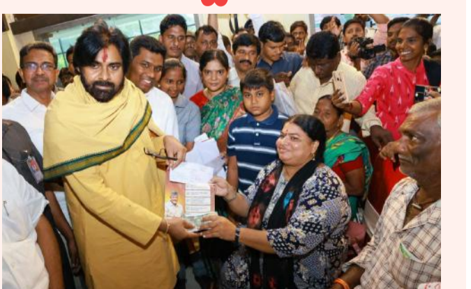
ఉన్నా ఎందుకు అడగలేదో అర్థం కాలేదన్నారు. చేపల చెరువులు ఉన్న చోట నీళ్లు లేవు, గోదావరి చుట్టూ ఉన్నా తాగడానికి నీళ్లు ఉండడం లేదని అన్నారు. ఇది గతవారి కుల పరిపాలనా లోపం అని ఎత్తి చూపారు. స్కూల్ డేవలప్మెంట్ జరగాలి.. ఏ యువతలో ఏ టేలెంట్ ఉందో ఎవరికి తెలియదు. వాటిని వెలికి తీసేందుకు కృషి చేస్తామన్నారు.

పెనుమాక వాళ్లు ఉన్నారంటే దివ్యాంగులైన గతంలో సీఎం చంద్రబాబు కూడా చెప్పారన్నారు. అందుకే వారికి ఈ ప్రభుత్వం పెన్షన్ల పెంచడం చెప్పారు. పంచాయితీ రాజ్ లెక్కలు చూస్తుంటే.. ఎటు వెళ్లాలి అర్థం కావట్లేదని గతవారి కుటుంబాలకు చురకలు అంటించారు. రూ. 600 కోట్లు ఖర్చు చేసి రుషికొండలో భవనాలు కట్టారని.. అదే డబ్బుతో ఎంతో అభివృద్ధి జరిగి ఉండేదని అన్నారు. ఇప్పుడు ఆ నిధులన్నీ బుడిదలో పోయిన పన్నీలు అయిందని విమర్శించారు. తన కార్యాలయంలోకి ఫర్మిచర్ ఇస్తాను అని అధికారులు చెబితే వద్దా నేనే తీసుకుంటాని చెప్పారన్నారు. తన వైపు నుండి అవినీతి అనేది ఉండదని మాట ఇస్తున్నారన్నారు. పంచాయితీ రాజ్ శాఖలో జలజీవన్ మిషన్ పథకంలో భాగంగా ప్రతి ఇంటికి మంచినీటి కుళాయి ఉండాలని ఆదేశించారు. కేంద్రంలో నిధులు