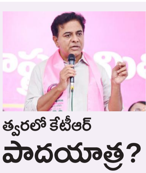
త్వరలో కేటీఆర్ పాదయాత్ర?

బీఆర్ఎస్ వర్కయింగ్ ప్రెసిడెంట్ కేటీఆర్ రాష్ట్రవ్యాప్తంగా పాదయాత్ర చేసే అవకాశం కనిపిస్తోంది. ఈ మేరకు పార్టీ చీఫ్ కేటీఆర్ కనరత్న చేస్తున్నారని తెలుస్తోంది. ఘోషాపాటీ పార్టీకి చెందిన పలువురు కీలక నేతలతో ఆయన ఈ అంశంపై చర్చించినట్లు సమాచారం. కాంగ్రెస్ పై ప్రజల్లో వ్యతిరేకత పెరుగుతోందని, దాన్ని తమను అభిమానంగా మార్చుకోవాలని కేటీఆర్ పేర్కొన్నట్లు పార్టీ వర్గాలు తెలిపాయి.