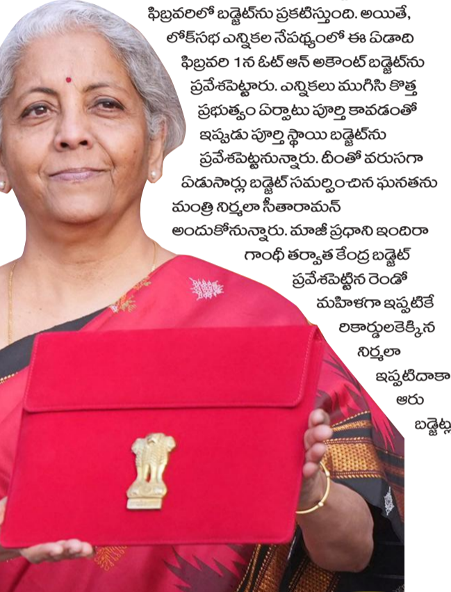
ఇప్పటికే బడ్జెట్ను ప్రవేశపెట్టారు.

వైఎస్ఆర్ 75వ జయంతిన పురస్కరించుకుని వైఎస్ఆర్ లిటిమ్ అధినేత వైఎస్ జగన్ ఇడుపులపాయలో తన తండ్రికి నివాళులు అర్పించారు. ముందుగా వైఎస్ఆర్ విగ్రహానికి పూలమాలవేసిన తరువాత తండ్రి వైఎస్ రాజశేఖర్ రెడ్డి సమాధి వద్దకు చేరుకున్నారు. వైఎస్ జగన్ కంటే ముందే వైఎస్ఆర్ ఘాట్ వద్దకు చేరకున్న తల్లి విజయమ్మను.. వైఎస్ జగన్ ఆలింగనం చేసుకున్నారు. అనంతరం ఇద్దరూ దివంగతనైన వైఎస్ఆర్ స్మారకంపై పుష్పగుచ్ఛం ఉంచి నివాళులు అర్పించారు. అనంతరం ప్రత్యేక ప్రార్థనలు చేశారు. వైఎస్ఆర్ 75వ జయంతిన పురస్కరించుకుని వైఎస్ఆర్ లిటిమ్ అధినేత వైఎస్ జగన్ ఇడుపులపాయలో తన తండ్రికి నివాళులు అర్పించారు. ముందుగా వైఎస్ఆర్ విగ్రహానికి పూలమాలవేసిన తరువాత తండ్రి వైఎస్ రాజశేఖర్ రెడ్డి సమాధి వద్దకు చేరుకున్నారు. వైఎస్ జగన్ కంటే ముందే వైఎస్ఆర్ ఘాట్ వద్దకు చేరకున్న తల్లి విజయమ్మను.. వైఎస్