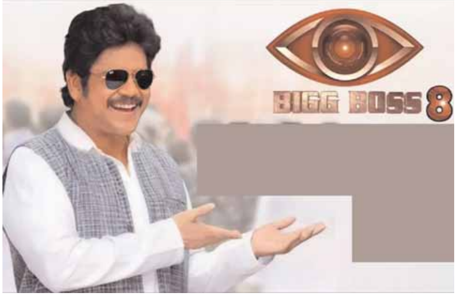
ఈమెను కూడా బిగ్ బాస్ షోకి తీసుకొస్తున్నట్లు చెబుతున్నారు. అయితే, కంటెస్టెంట్ల ఎవరనేది తెలియాలంటే మాత్రం షో మొదలు కావాల్సిందే.