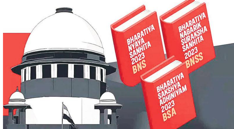
ఆడియో, వీడియో సాక్ష్యాలను జాతీయ స్థాయిలో ఏర్పాటు చేసిన డిజి లాక్సత్ భద్రపరుస్తారు. పెళ్లి చేసుకుంటానని చెప్పి తప్పుడు వాగ్మూలాలతో సంబంధాలు పెట్టుకునే వారిపై కొత్త చట్టాల్లో కఠిన శిక్షలు ఉన్నాయి.

మహిళా భద్రతకు పెద్దపీట కొత్త నేర, న్యాయ చట్టాల ప్రకారం.. క్రిమినల్ కేసుల్లో విచారణ పూర్తయిన 45 రోజుల్లోగా తీర్పు ఇవ్వాలి. మొదటి విచారణ నుంచి 60 రోజులలోపే అభియోగాలను నమోదు చేయాలి. 3 నుంచి 7 ఏళ్లలోపు శిక్ష వదల కేసుల్లో ఫిర్యాదు అందిన 24 గంటల్లోనే ఎఫ్ఐఆర్ నమోదు చేయాలి. 14 రోజుల్లోనే ఈ కేసును కొలిక్కి తెచ్చాలి. అత్యాచార బాధితుల వాంగ్మూలాన్ని సంరక్షకుల సమక్షంలో మహిళా పోలీసు అధికారి నమోదు చేయాల్సి ఉంటుంది. ఆ బాధితురాలి వైద్య నివేదికలు ఏడు రోజుల్లోనే సిద్ధం చేయాలి. మహిళలు, చిన్నారులపై జరిగే నేరాలలో దర్యాప్తును రెండు నెలల్లోనే పూర్తి చేయాలి. బాధితుల వాంగ్మూలాన్ని మహిళా మెజిస్ట్రేట్ ముందు నమోదు చేయాలి. వాళ్లు లేకుంటే మహిళా సిబ్బంది ఎవరైనా పురుష మెజిస్ట్రేట్ ముందు హాజరుపర్చాలి. అత్యాచార కేసుల్లో బాధితురాలి వాంగ్మూలాన్ని ఆడియో, వీడియోల ద్వారా సేకరించి పోలీసులు కేసు నమోదు చేయాలి. అయితే పోక్సో కేసుల్లో బాధితురాలి వాంగ్మూలాలు పోలీసులే కాకుండా మహిళా ప్రభుత్వ అధికారి ఎవరైనా నమోదు చేయొచ్చు. క్రిమినల్ కేసుల విచారణలో అలస్యాన్ని నివారించడానికి న్యాయస్థానాలు గరిష్టంగా కేవలం రెండు వాయిదాలు మాత్రమే మంజూరు చేయాల్సి ఉంటుంది. సాక్షుల వాంగ్మూలాలు,