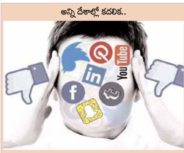
అన్ని డేటాకోర్ కదలిక.. సామాజిక మాధ్యమాలకు కల్లెం వేసిన చైనా లాగే ప్రాన్స్ రంగంలోకి దిగింది. తల్లిదండ్రులకు అమాహాన లేకనో. ముప్పుట పడో. పదిమందికి తెలియాలన్న ఆత్మకతో.. తమ పిల్లల ఫోటోలను పదే పదే సామాజిక మాధ్యమాల్లో పోస్టు చేస్తుంటారు. ఆ చిత్రాలే సైబర్ నేరగాళ్లకు, బుల్లియంట్ బదుద్దాలకు ఆయుధాలవుతున్నాయి. చైల్డ్ ఫోర్స్ గ్రూప్ వెబ్సైట్లో సైతం పిల్లలు, టీనేజర్ల ఫోటోలు, మార్పింగ్ వీడియోలు పెట్టి తల్లిదండ్రులను డబ్బు కోసం వేధించే

ద్వారా సంభాషించడం కన్నా ముఖాముఖీగా మాట్లాడుకోవడం వల్ల మానవ సంబంధాల నాణ్యతను మెరుగుపరచుకోవచ్చు. ఈ విధమైన సంస్కృతిని మానసిక సమస్యలను దరిచేరకుండా నివారించే పరిశోధన బ్యాంధం సూచించింది. ఇటీవల ఒక కథనం ప్రకారం 2024లో, భారతదేశంలో సోషల్ మీడియా వాడకం గణనీయంగా పెరిగిందని తెలిసింది. ప్రపంచవ్యాప్తంగా సోషల్ మీడియా వినియోగిస్తున్న వారిలో భారతదేశం వాటా 32.2% అంటే 46 కోట్ల మంది మనదేశంలో సోషల్ మీడియా వినియోగిస్తున్నారని తెలుస్తుంది.