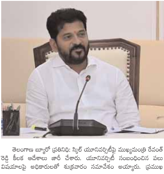
తెలంగాణ బ్యూరో ప్రతినిధి: స్థిర యూనివర్సిటీపై ముఖ్యమంత్రి రేవంత్ రెడ్డి కీలక ఆదేశాలు జారీ చేశారు. యూనివర్సిటీ సంబంధించిన పలు విషయాలపై అధికారులతో శుభ్రతలను సమావేశం అయ్యారు. ప్రముఖ

సిసిలీలు, రియల్ ఎస్టేట్ సంబంధించిన వారి వ్యక్తిగత విషయాలు తెలుసుకునేందుకు ఫోన్ ల్యాంకింగ్ లాంటి అంశాలపై ఫోకస్ చేశారంటూ మండిపడ్డారు. వేలకోట్లతో నిర్మించిన కార్యకర్తల ప్రాజెక్టులో భాగం అవ్వని జరిగిందని, త్వరలోనే బీఆర్ఎస్ ప్రభుత్వం అన్ని కుట్రల్ని ప్రజలకు అర్థమయ్యేలా చేస్తామన్నారు. బీఆర్ఎస్ మంచి చేస్తే మంచి అని చెబితాం, కానీ వారి చెడును కూడా ప్రజలకు చూపించాల్సిన బాధ్యత తమపై ఉందన్నారు. వేల కోట్ల ప్రజల సొమ్మును కేసీఆర్ ప్రభుత్వం మర్చిపోయారని చేసినందన ఆరోపించారు. నాలుగు గోడల మధ్య కాంగ్రెస్ ప్రభుత్వం నిర్ణయాలు తీసుకోవడం, తమది ప్రజా ప్రభుత్వం కనుక, వారి అభిప్రాయాలకు అనుగుణంగా పాలన చేస్తున్నట్లు పేర్కొన్నారు.