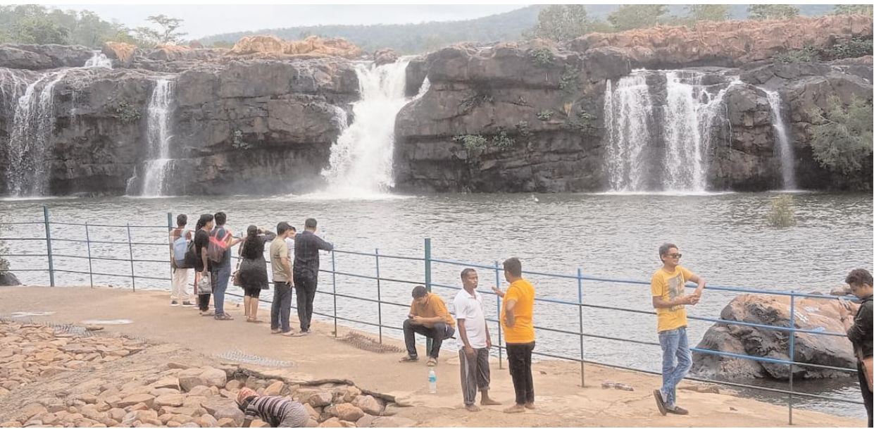
జలపాతాన్ని వీక్షించడానికి పిల్లలపాలతో వచ్చిన పర్యాటకులు బొగత అందాన్ని చూసి ఎంతో సంతోషం వ్యక్తం చేస్తున్నారు. ఈ జలపాతాన్ని చూడడానికి దేశ విదేశాల నుంచి రావడం విశేషం. బొగత అందాలను తమ కెమెరాలు బంధించి ఎంతో ఆనందం వ్యక్తం చేస్తున్నారు.