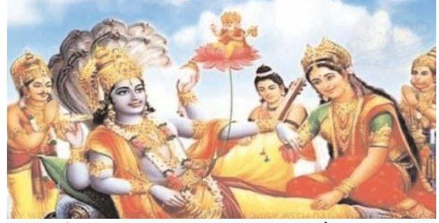
యుజ్యం పొందినట్లుగా పురాణాలు చెబుతున్నాయి. అంబరీషుడు, మాంధాత, తదితర పురాణ పురుషులు ఏకాదశి వ్రతాన్ని ఆచరించినట్లు రుషులు చెబుతారు.

మహాబూబాబాద్ ప్రతినీధి, జూలై16,మేజర్ న్యూస్(సూర్య): హిందువుల తొలి పండుగ తొలి ఏకాదశి. ఈ పర్వదినంతోనే మన పండగలు మొదలవుతాయి. వరసగా వినాయక చవితి, దసరా, దీపావళి, సంక్రాంతి పండగలు వస్తాయి. హైందవ సంస్కృతిలో తొలి ఏకాదశికి విశేష స్థానముంది. దీన్ని 'శయనైకాదశి' అని, 'హరి వాసరం', 'పేలాల పండగ' అని కూడా పిలుస్తారు. తొలి ఏకాదశి సందర్భంగా.. ఈ పండగ విశిష్టత, పూజా విధానం గురించి తెలుసుకుందాం..ఒక ఏడాదిలో 24 ఏకాదశుల్లో వస్తాయి. వీటిలో ఆషాఢ శుద్ధ ఏకాదశిని 'తొలి ఏకాదశి'గా పిలుస్తారు. పురాణాల ప్రకారం.. శ్రీమహావిష్ణువు క్షీరసాగరంలో శేషతల్పంపై నాలుగు నెలల పాటు శయనిస్తాడు. ఆకోబర్ లేదా నవంబర్ నెలల్లో వచ్చే ప్రబోధినీ ఏకాదశి ఆయన తిరిగి మేల్కొంటాడు.ఈ నాలుగు నెలల్ని చాతుర్మాసాలుగా వ్యవహరిస్తారు. తొలి ఏకాదశి నుంచి 4 నెలల పాటు చాతుర్మాసదీక్షను ఆచరిస్తారు. ఈ నాలుగు నెలలు స్వామివారు పాతాళ లోకంలో బలి చక్రవర్తి వద్ద ఉండి కార్తీక పౌర్ణమి నాడు తిరిగి వస్తాడని పురాణాధ ఒకటి ప్రాచుర్యంలో ఉంది.