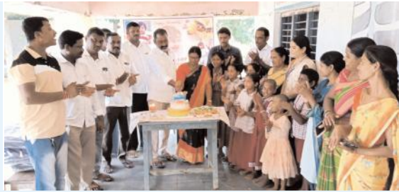
ఘనంగా బాల్నీ ఈశాన్ జన్మదిన వేడుకలు ...!

విద్యార్థులకు ఉచితంగా బ్యాగుల పంపిణీ, అన్నదానం