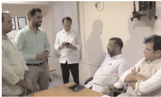
దీన్ని ఆఫీసు అంటారా