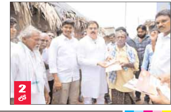
తెనాలి నియోజకవర్గంలో ఎన్టీఆర్ భరోసా సామాజిక పింఛన్ల పంపిణీ కార్యక్రమం పండుగలా సాగింది. ఒకటి తేటి కావడంతో గురువారం ఉదయమే పింఛన్లను పంపిణీ చేసేందుకు యంత్రాంగం సిద్ధమైంది.