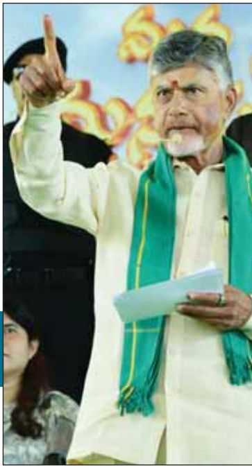
నీరు సంపదను సృష్టిస్తుందని, తద్వారా పేదరిక నిర్మూలన జరుగుతుందని ముఖ్యమంత్రి చంద్రబాబు నాయుడు అన్నారు. నంద్యాల జిల్లా సున్నిపేట నీటి వినియోగదారుల సంఘం ప్రతినిధులతో ముఖ్యమంత్రి నారా చంద్రబాబు నాయుడు గురువారం సమావేశమయ్యారు. ఈ సందర్భంగా ఆయన మాట్లాడుతూ.. పేదరికంలేని సమాజాన్ని ఏర్పాటు చేసుకోవాలి.