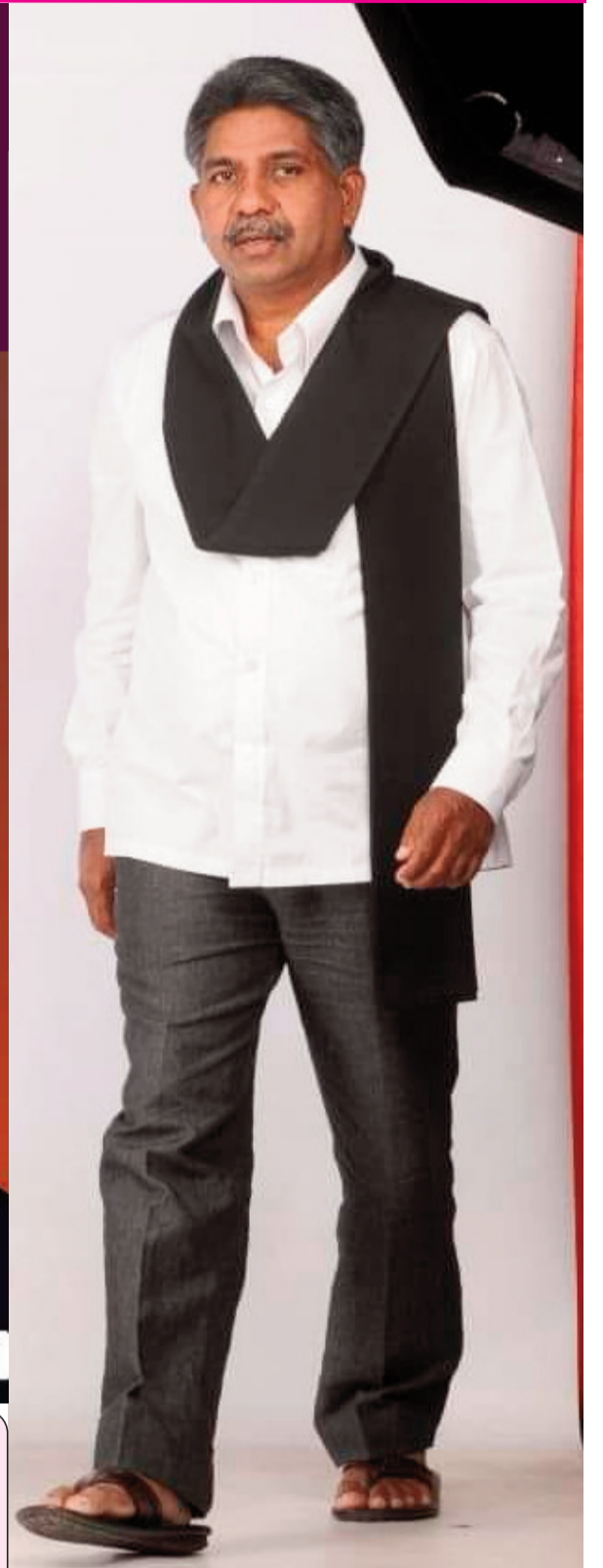
అసలు ఈ ఎస్సీ వర్గీకరణ అంటే ఏమిటి? దేనికి? అంటే ఎస్సీ జనాభాలో 10 శాతం మాత్రమే ఉన్న మూలకు రిజర్వేషన్లలో 90 శాతం పొందుతూ ఎక్కువ లబ్ధి పొందుతుండగా, ఎస్సీలో 80 శాతం జనాభా ఉన్న మూడుగలకు కేవలం 10 శాతం రిజర్వేషన్లు మాత్రమే లభిస్తుండటం వలన విద్య, ఉద్యోగాల పోటీలో వెనుకబడిపోతున్నారు. కనుక బీసీలలో ఏ.బీ.సి.డి అని వర్గీకరణ చేస్తున్నట్లు ఎస్సీలో కూడా ఏ.బీ.సి.డి అని వర్గీకరణ చేసి జనాభా ప్రతిపదికన మూడుగలకు ఎక్కువ శాతం రిజర్వేషన్లు ఇవ్వాలని కోరుతూ మంద కృష్ణ మాదిగ పోరాటం కొనసాగించారు.