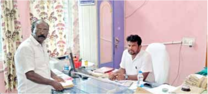
విచారణ చేపట్టిన ప్రత్యేక డిప్యూటీ కలెక్టర్