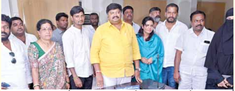
నూతన స్టాండింగ్ కమిటీ సభ్యుల అభినందనలు తెలియజేస్తూ మాట్లాడుతున్న ఎమ్మెల్యే గురుజాల