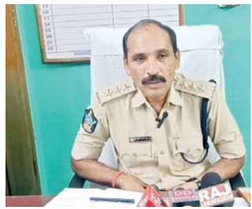
నేరాలకు గురైతే వెంటనే 1930కు కాల్ చేస్తే వెంటనే వాళ్లకు తగిన విధమైన సహాయకారాలు జరిగే విధంగా ప్రభుత్వం కార్యాచరణ చేపట్టింది తెలియజేశారు.

ఫోన్ ఓటీపీ చెప్పవద్దని అన్నారు. మీకు బ్యాంకు నుండి ఫోన్ చేస్తున్నాము డబ్బులు మీ అకౌంట్లో జమవుతాయి ఓటీపీ చెప్పండి అని కాల్ చేసిన వారికి ఓటీపీలు ఆధార్ కార్డు నెంబర్ చెప్పవద్దని అపరిచితుల నుంచి ఎస్ఎంఎస్, ఈ మెయిల్, వాట్సాప్ ద్వారా వచ్చే బ్లాగ్ కలర్ లింక్స్ ను క్లిక్ చేస్తే, మీ మొబైల్ లోని డేటా మొత్తం సైబర్ నేరగాళ్ల చేతుల్లోకి పోతుందని హెచ్చరించారు.